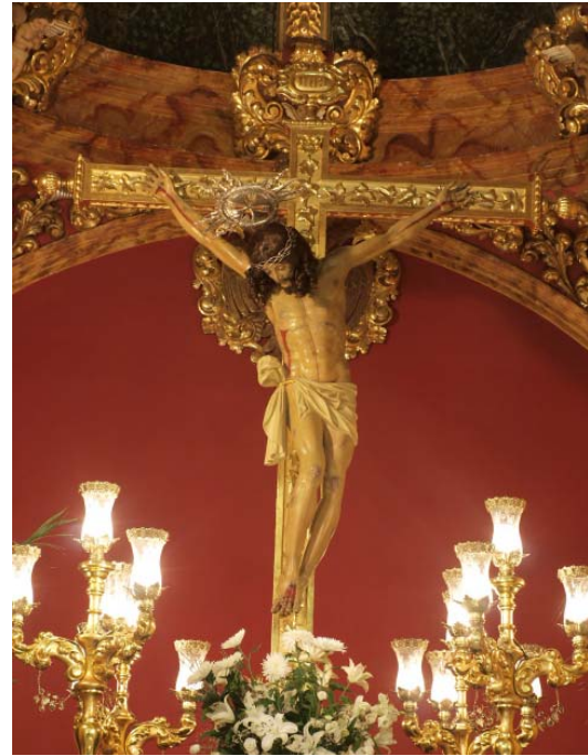
▪ Fig. 5. Santo Cristo de la Yedra . Valor (Granada). Iglesia parroquial de San José. Atrib. Alonso de Mena, anterior a 1620.

ño de Valor, atribuible a Alonso de Mena (Figs. 5 y 6).