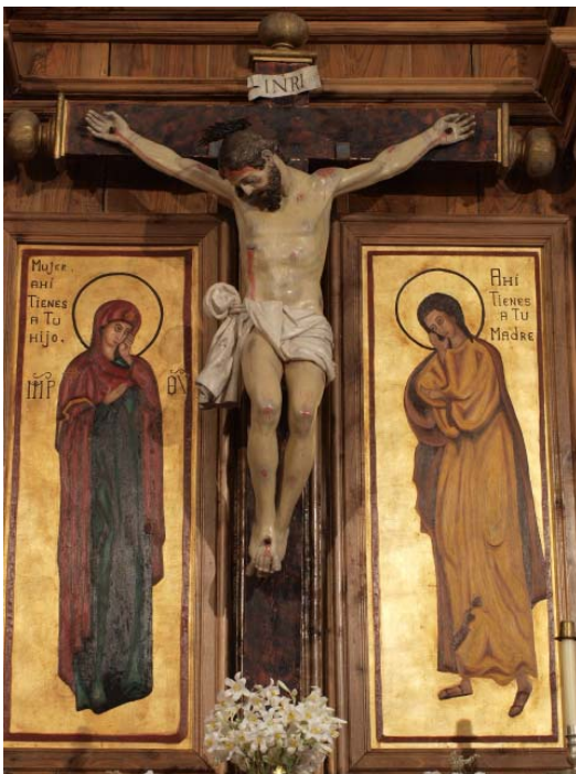
▪ Fig. 7. Crucificado . Trevélez (Granada). Iglesia parroquial de San Benito. Atrib. Alonso de Mena, anterior a 1620.

mismo se aprecia enormemente afecto a las formas de Pablo de Rojas, aunque ya se ve el característico mechón, anteriormente citado, que acostumbra Alonso de Mena a esculpir. Si bien la pose de la cabeza y el tórax emula las trazas del maestro, el desarrollo de las piernas se vislumbra ya diferente, siguiendo ya la línea que mantuvo en otros crucificados como el de la iglesia de las Carmelitas Calzadas de Granada (entre 1622 y 1624), el de Santafé (c. 1620) o el de la parroquial de Albuñuelas (1620). Curiosa resulta la factura del paño de pureza, que aunque recuerda las hechuras de Pablo de Rojas, elabora un bello pliegue sobre el muslo derecho que se dobla sobre sí mismo. Según lo dicho, se considera que ambas piezas podrían ser muestras del trabajo primigenio de Alonso de Mena, toda vez que se ve claramente ese proceso evolutivo en su obra, distanciándose progresivamente de las líneas de su preceptor. Y para ello, qué mejor forma que realizarlo en el que fuera un “laboratorio de pruebas” por extensión y posibilidades como fue una Alpujarra necesitada de imágenes de culto para sus iglesias (Figs. 7 y 8).