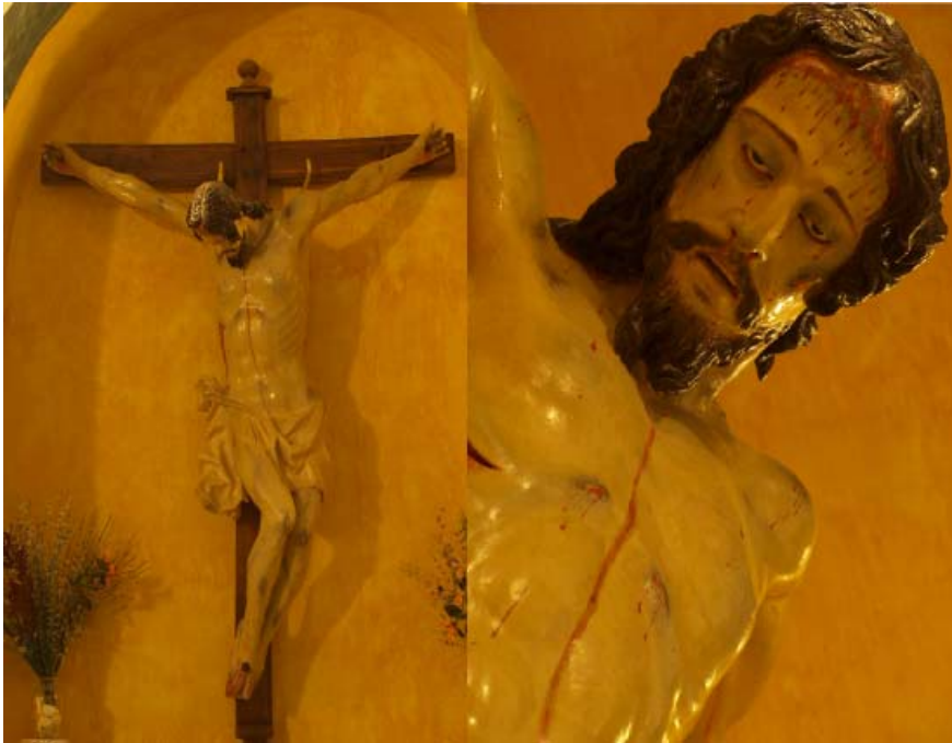
▪ Fig. 11. Crucificado . Cáñar (Granada). Iglesia parroquial de Santa Ana. Atrib. Alonso de Mena, anterior a 1620.

En el caso de Cáñar, aparte de que evoca claramente a las muestras citadas, al observar la factura del bigote y la barba, se deduce su evidente parecido en las formas. Así pues, estas razones hacen pensar que volvemos a encontrarnos con imágenes previas a las que hasta ahora se consideraban los primeros ejemplos de crucificados de Alonso de Mena: el de la parroquial de Albuñuelas (1620) y el de Adra (1622). Por tanto, y refiriendo que se observa que están a caballo entre su dependencia de la obra de Rojas y las citadas tallas documentadas, pensamos que todas estas piezas antecederían a 1620, siendo atribuibles a su factura.