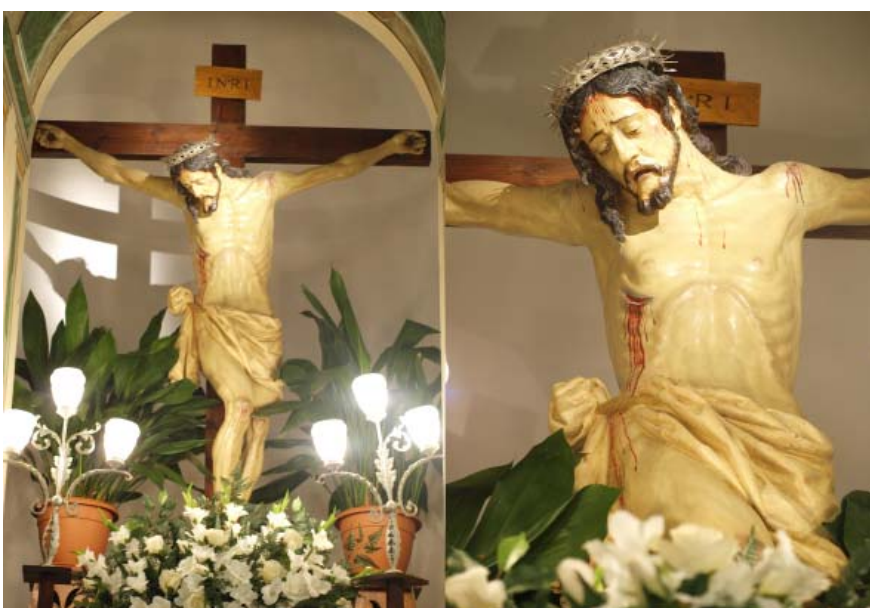
▪ Fig. 10. Crucificado . Mecina Fondales (Granada). Iglesia parroquial de Santa María de La Encarnación. Atrib. Alonso de Mena, anterior a 1620.