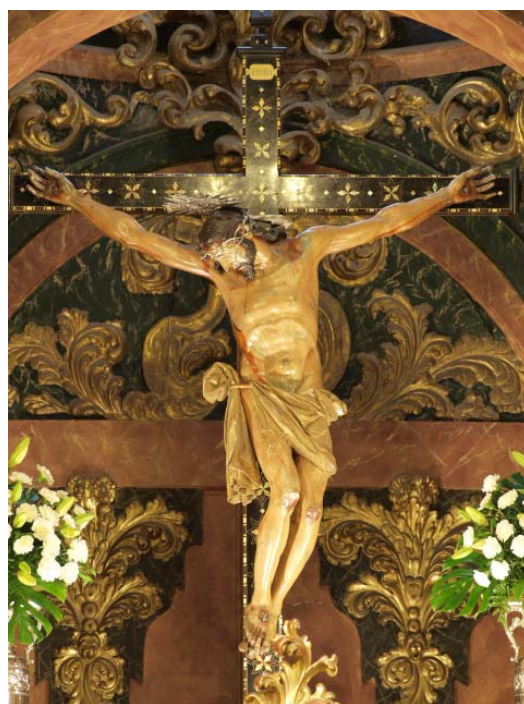
▪ Fig. 1. Cristo de la Expiración. Órgiva (Granada). Iglesia parroquial de Ntra. Sra. de la Expectación. Atrib. Pablo de Rojas, c. 1590.

aproximadamente, a caballo entre las citadas obras de la granadina Basílica de las Angustias (1582) y la del Cristo de la Esperanza de la Sacristía de Beneficiados de la Catedral de Granada (1592). Esta imagen, a diferencia de la hipótesis que formulábamos en la introducción, parece ser que pudo ser adquirida en 1815, en Granada, por veinte reales de vellón, y uno más por escriturarla. La talla sería trasladada a caballo, tardándose en ello cuatro días. Dicha información viene recogida en la página web de la Hermandad del Cristo de la Expiración 14 (Figs. 1 y 2).