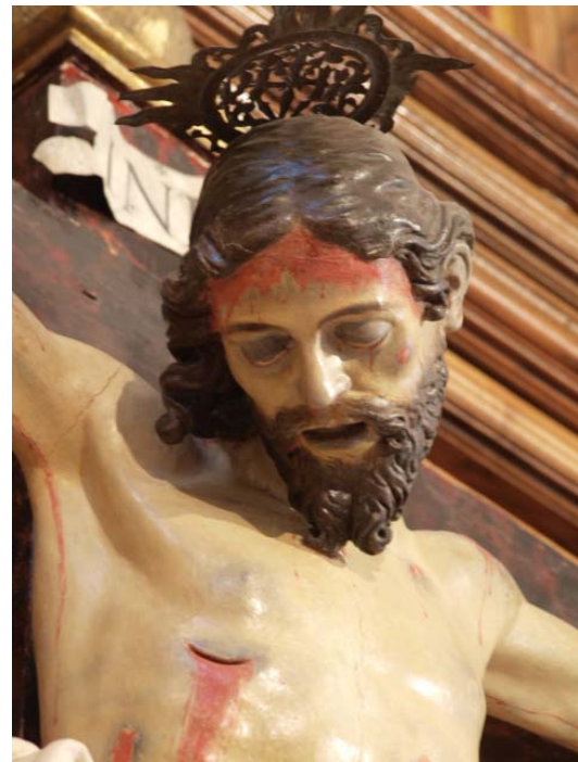
▪ Fig. 8. Crucificado . Trevélez (Granada). Iglesia parroquial de San Benito. Atrib. Alonso de Mena, anterior a 1620. Detalle.

No muy distantes en el tiempo deben andar los Crucificados de Cañar, Capileira y Mecina Fondales (todos ellos municipios de La Alpujarra granadina) entre sí, y también con respecto a las antecedentes que se han visto. En ese tránsito hacia las trazas más prototípicas de Mena, vuelven a encontrarse dos ejemplos intermedios, muestra perfecta de esa mezcla entre el maestro y el discípulo. En líneas generales, se observa cómo en las diferentes cabezas se van viendo ya los rasgos característicos de los rostros de Alonso de Mena: contundencia, mayor realismo, dureza..., por lo que se denota un tipo más consolidado en cuanto a las formas faciales. Ahora bien, hay que reseñar un detalle importante: todavía no talla la corona de espinas como acostumbrará en modelos posteriores. En este sentido, se ofrecen tipos iconográficos anteriores a su contacto con Andrés de Ocampo y, sobre todo, al realismo violento de Juan de Mesa, en donde sí se percibe esta particularidad. De igual modo, las extremidades y la silueta en su conjunto se perciben notoriamente dependientes de los modelos