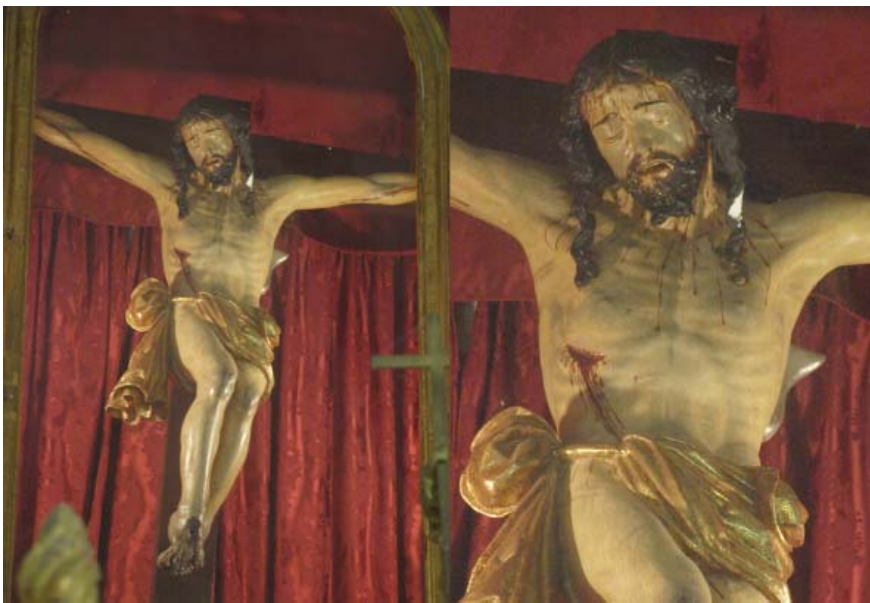
▪ Fig. 9. Crucificado . Capileira (Granada). Iglesia parroquial de Santa María de la Cabeza. Atrib. Alonso de Mena, anterior a 1620.

rostro, éste muestra similitudes tanto con el de Carcabuey (Córdoba), como con el de Albuñuelas. Igualmente, esta semejanza se hace todavía más acentuada en el ejemplo de Capileira, barruntándose en este caso los estilemas que terminará desarrollando en el ejemplo de Adra (Almería). Finalmente, el perizoma tan volado se puede poner en relación con el de las Carmelitas Descalzas (Figs. 9, 10 y 11).