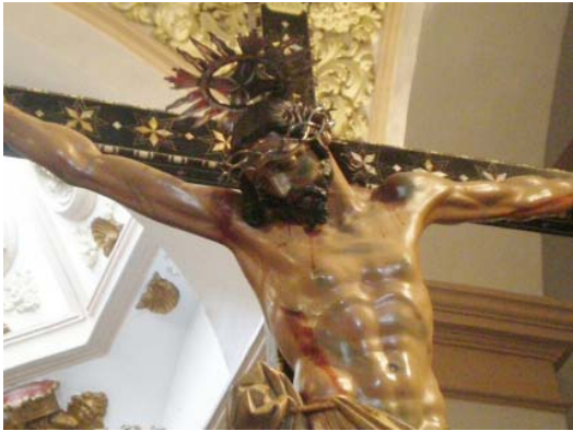
▪ Fig. 2. Cristo de la Expiración . Órgiva (Granada). Iglesia parroquial de Ntra. Sra. de la Expectación. Atrib. Pablo de Rojas, c. 1590. Detalle.

Subiendo por los parajes alpujarreños granadinos encontramos la pequeña localidad de Bérchules, en cuya iglesia, concretamente en su sacristía, hallamos otra pieza relacionable con las gubias de Pablo de Rojas. La imagen, nuevamente, representa a Cristo crucificado, de tamaño académico y clavado con tres clavos. El mismo se presenta aún vivo, con la cabeza erguida, quizás queriendo evocar los últimos diálogos del Señor que se relatan en el Evangelio de San Juan. Persiste, pues, la intencionalidad evangelizadora. La talla ofrece mayor corpulencia que el ejemplo orgiveño previamente descrito, presentando una anatomía muy bien cuidada, propia del naturalismo escultórico.