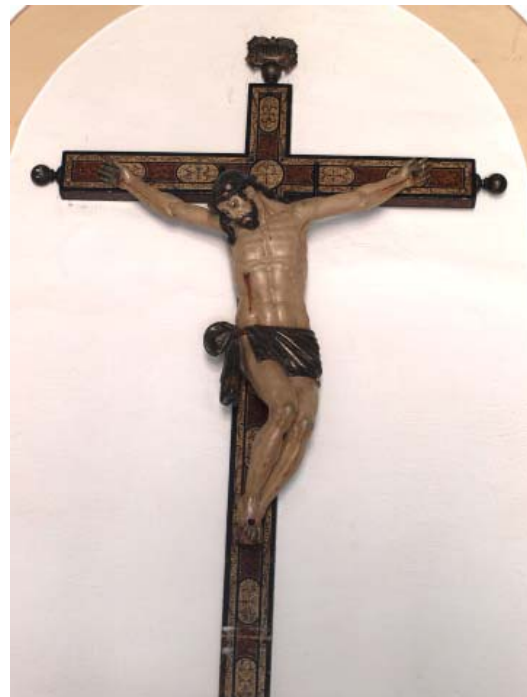
▪ Fig. 4. Crucificado . Juviles (Granada). Iglesia parroquial de San Sebastián. Círculo de Pablo de Rojas, finales del siglo XVI o principios del XVII.

Rojas, denota que en ese retoque que ha sufrido se han querido resaltar las líneas de la musculatura ex profeso . Las piernas giran hacia la derecha de forma paralela, como en ejemplos que hemos visto, y en el perizoma se ven los resabios de los modelos del alcalaíno. Donde más se aleja de los cánones clásicos que esboza Rojas es en la cabeza. La disposición del cabello, en líneas generales, suele ser la acostumbrada en su obra, aunque llama la atención el mechón suelto que cae por el flanco derecho, que difiere de las resoluciones habituales que tiende a usar en los crucificados. El rostro es quizás lo que más descoloca de la imagen, puesto que se aleja de las formas idealizadas y romanistas que tiende a ejecutar. Es, pues, una representación más barroca, con rasgos más realistas y distantes del arquetipo del genial escultor. Resulta difícil determinar si ello ha sido a consecuencia de la mencionada intervención que se sostiene que se ha producido, o que realmente, en su origen, la imagen fue concebida así (Fig. 4).