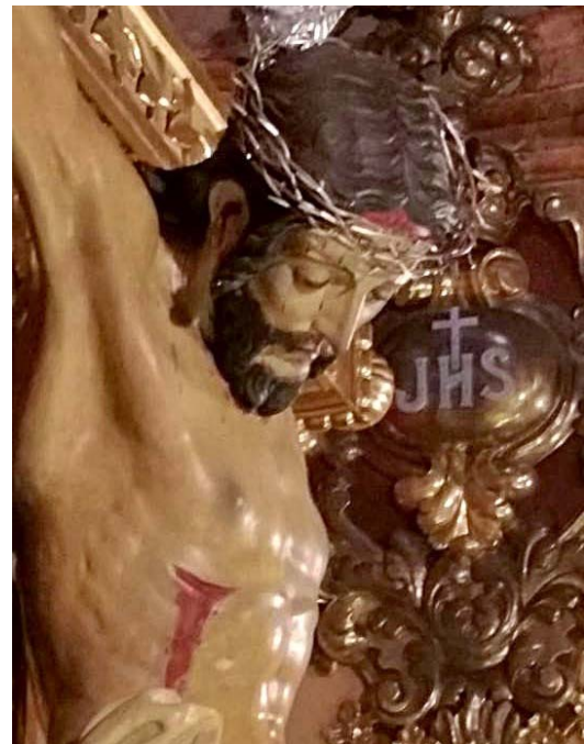
▪ Fig. 6. Santo Cristo de la Yedra . Valor (Granada). Iglesia parroquial de San José. Atrib. Alonso de Mena, anterior a 1620. Detalle.