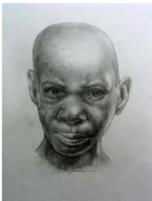
Figura 3. Benjamina (Kennis&Kennis)

Y... no nos hemos olvidado de Darwin, aunque lo pueda parecer. La pregunta que hoy le haríamos al Gran Sabio, a sabiendas de que también se preocupó de otras fuentes de selección además de la natural, se refiere a lo que tuvo que ocurrir en el caso de Benjamina .