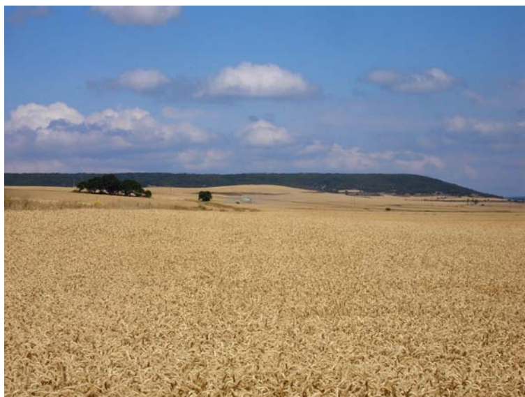
Figura 1. Sierra de Atapuerca (Lira)

Benjamina es el nombre que ha recibido el último cráneo procedente de la Sima de los Huesos de la sierra de Atapuerca ( Fig. 1 ) que ha sido publicado. Se trata de un cráneo infantil, que corresponde a un individuo que murió alrededor de los 10 años de edad, y que probablemente perteneció a una niña. Aún se duda de a qué sexo perteneció precisamente por la corta edad a la que murió, previa a que la aparición de los caracteres sexuales secundarios quedaran claramente “impresos” en el cráneo. Sin embargo, la existencia de otros ejemplares inmaduros en la muestra, como por ejemplo el Cráneo 6, permiten un estudio comparativo que, aunque resulte solo tentativo por la escasez de la muestra, hacen sospechar que el Cráneo 14, Benjamina , pudiera haber pertenecido a una niña, entre otros rasgos por la gracilidad de sus caracteres.