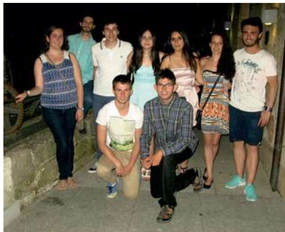
Figura 2. Estudiantes del Grado de Biotecnología de la Universidad de León que participaron en el Congreso Anual de Biotecnología en Salamanca el pasado Julio.

Por último, animamos no solamente a los biotecnólogos de León, también a los alumnos de los grados de Biología y de Ciencias Ambientales a participar en futuras ediciones del congreso.