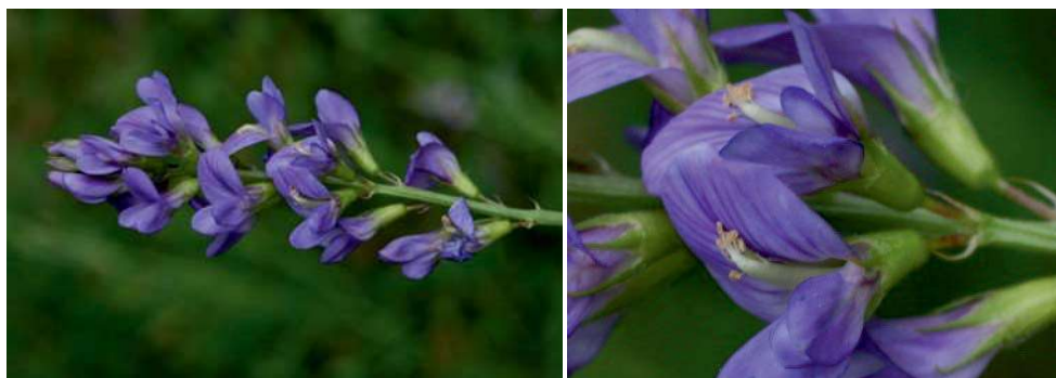
Figura 2. Inflorescencia de Medicago sativa L. (alfalfa) y detalle de la flor papilionada.

do el superior el estandarte, los laterales las alas, y los dos inferiores e internos forman la quilla que rodea tanto a androceo como a gineceo; el androceo tiene diez estambres de los que nueve están connados y el décimo (en posición adaxial) parcial o totalmente separado del grupo; el gineceo está formado por un solo carpelo, con varios óvulos mayoritariamente campilótrofos ( Fig. 2 ).