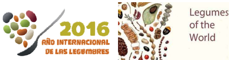
Figura 1. Representación del diferente concepto de legumbre desde el punto de vista alimenticio (FAO 2016) y de acuerdo con el concepto botánico (modificado de LOWO, 2005).

buyen al enriquecimiento del suelo. Aunque botánicamente se llama legumbre a los frutos que forman las plantas de esta familia, desde un punto de vista alimentario la FAO solo considera legumbres las semillas de las plantas de esta familia que se consumen en seco (descartando tanto las verduras u hortalizas que se consumen frescas, como los guisantes o los tirabeques, las especies forrajeras o las cultivadas para la producción de biocombustibles (FAO 2016).