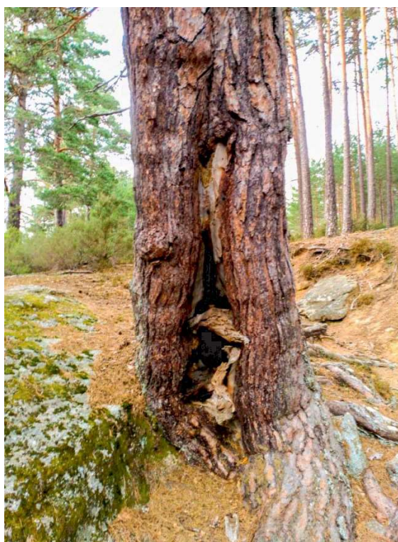
Figura 2. Ejemplar de Pinus sylvestris L. de Duruelo de la Sierra (Soria), con una peguera antigua en su base utilizada para sacar resina por medio del calentamiento del pino con fuego.

Su aprovechamiento por parte del hombre continuó con especial importancia a partir del siglo XVI para el calafateado de los barcos, gracias a la demanda de las grandes potencias marítimas como la española, la inglesa o la holandesa (Delgado Macías, 2015). Los países nórdicos eran los principales productores de resina ya que ésta se extraía tras calentar la madera o el propio pino por medio de pegueras ( Fig.2 ), sin tener que recogerse la exudada por los pinos vivos mediante heridas ( Fig.3 ) (Uriarte Ayo y Sebastián Amarilla, 2003). A principios del siglo XIX, la llegada de la construcción naval metálica provocó una decadencia en el uso de la resina como impermeabilizante (Coppen y Hone, 1995). Desde ese momento, gracias a la aparición de la industria química, la resina encontró un importante nicho industrial que ha mantenido hasta la actualidad. En esta industria se empezaron a utilizar los productos obtenidos tras la destilación de la resina: colofonia (70%), aguarrás (20%) y restos de agua y pez (10%). De ellos se obtenían diluyentes, ceras, insecticidas, creosota, barnices o, incluso jabón, entre otros muchos productos. Los jabones creados con colofonia fueron sustituyendo a los duros y malolientes jabones de sebo, y a los muy viscosos obtenidos con aceite (Delgado Macías, 2015). Para la destilación de la resina, ésta tenía que extraerse directamente de los pinos vivos recogiendo en recipientes tras resbalar por la