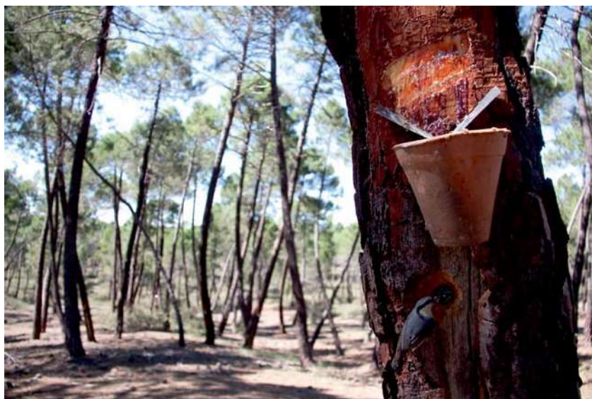
Figura 3. En la fotografía se muestra un nido de trepador azul ( Sitta europaea L.) en una cara antigua cicatrizada, justo por debajo de un recipiente que recoge la resina de la nueva cara trabajada por el método actual.

cara de los troncos. Dicho método es el que se mantiene en la actualidad ( Fig.3 ). El cambio en el procedimiento de obtención provocó que la producción se desplazara hacia países de zonas más cálidas del Mediterráneo y Norteamérica (Uriarte Ayo y Sebastián Amarilla, 2003).