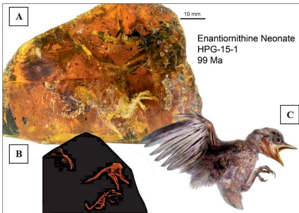
Figura 1. A) Pieza de ámbar fósil con restos muy bien conservados de un pollo Enantiornithine. B) Esquema detallado de los restos encontrados. C) Reconstrucción artística del pollo que quedó atrapado dentro de la resina hace unos 99 millones de años (tomado de Forssmann, 2017).

El ámbar ha sido un recurso fundamental en el conocimiento del pasado del planeta, pues en multitud de ocasiones se han encontrado en su interior pequeños animales o restos de plantas conservados en perfectas condiciones, manteniendo incluso partes blandas. Así, en el ámbar del Mesozoico se han encontrado en excelentes condiciones plumas y proto plumas de dinosaurios, colas de lagartos y pelos de mamíferos. Por otro lado, en el ámbar del Cenozoico (cuando la resina era más fluida y abundante), se han encontrado artrópodos e incluso pequeños vertebrados. Llamamos especialmente la atención algunos artrópodos cubiertos de polen, o insectos hematófagos en cuyo tubo digestivo había nematodos parásitos de vertebrados, así como algunas aves pequeñas perfectamente conservadas ( Fig.1 ).