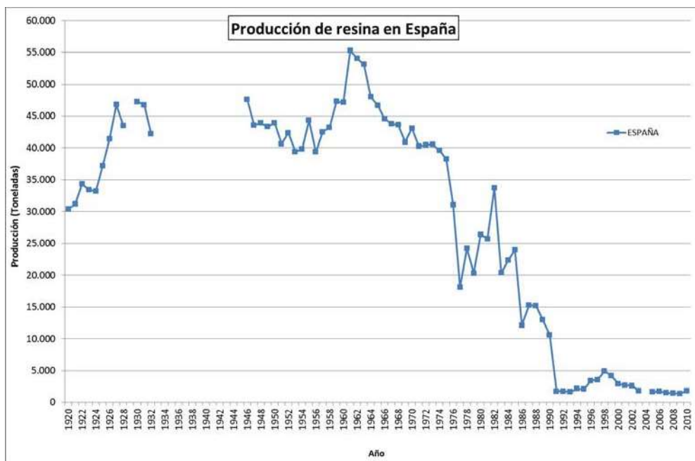
Figura 4. Producción de resina en España desde 1920 hasta 2010 (tomado de Picardo Nieto y Pinillos Herrero, 2013).

parición a principios de la década de los 90 ( Fig.4 ). La competencia con países menos desarrollados con gran potencial forestal, el auge del petróleo y el encarecimiento de la mano de obra provocado por el éxodo rural, provocaron que la resina española dejara de ser un producto económicamente competitivo a nivel mundial (Uriarte Ayo y Sebastián Amarilla, 2003). Este hecho trajo consigo grandes perjuicios a muchos pueblos españoles que dependían directamente del aprovechamiento de la resina (Perez et al. , 2013).