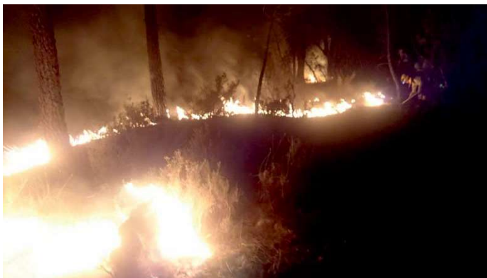
Figura 6. Fotografía de un incendio ocurrido en un pinar de pino resinero ( Pinus pinaster Ait.) de Cañamares (Cuenca).

Algunas estimaciones pronostican que en España se podrían producir, razonablemente, unas 45.000 t/año, aunque con una buena gestión sería factible que aumentara la producción hasta las 75.000 t/año. Esta planificación del aprovechamiento daría trabajo de manera directa a unos 6.000 resineros (Picardo Nieto y Pinillos Herrero, 2013). La temporalidad del oficio no podrá ser ampliada, puesto que los pinos requieren unas condiciones de calor para producir resina. De hecho, si se resinaran en invierno, se dañarían gravemente. Sin embargo, existen alternativas de trabajo para los resineros durante los meses fríos, como pueden ser los aprovechamientos forestales o los tratamientos silvícolas; prácticas que ya se están llevando a cabo en muchas comarcas con un exitoso resultado. Además, esta combinación de trabajo implicaría la conservación de nuestros pinares resineros, ya que desde su abandono, los devastadores incendios se han multiplicado considerablemente debido al aumento del combustible disponible ( Fig.6 ). Esto se ve reflejado en los datos peninsulares de los incendios forestales en la década 2000-2010, donde el número de incendios en pinares de esta especie ha supuesto el 27% total de los incendios ocurridos en toda España (Picardo Nieto y Pinillos Herrero, 2013). A estas cifras hay que añadir las 11 víctimas humanas ocurridas en el verano de 2005 en el incendio de la antigua zona resinera de Guadalajara que arrasó algo más de 10.000 ha.