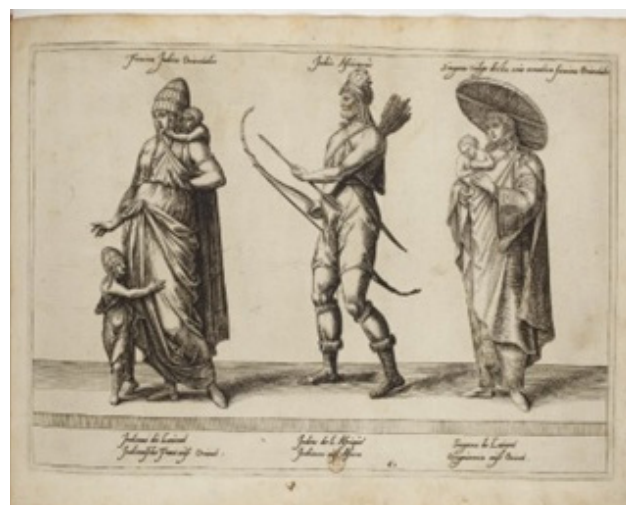
Imaxe 5: "Singara vulgo dicta siue erratica Orientalis", grabáu del llibru Habitus Variarum Orbis gentium. Habitz de Nations estrâges. Trachten mancherley Völcker des Erdsckreyß de Jan Jaques Boissard, Caspar Rutz, Julius Golcius y Abraham de Bruyn (1581: 61)

El nome que designa la figura de la sotadera ye bien suxestivu: deriva del verbu sotar , que'l DRAE define como "bailar", "ejecutar movimientos acompasados", añadiendo que se trata d'un términu en desusu rexistráu en Burgos (Real Academia Española, 2023). La etimoloxía de sotar hai que la buscar no términu llatín SALTĀRE 'baillar', y parez una voz patrimonial romance que nun s'acabó xeneralizando, cumo si fizo'l sou dobrete saltar . Afallamos tamién el verbu sotar no Libro de buen amor (ca. 1330-1343) de Juan Ruiz, Arcipreste de Hita (2006), obra na que'l verbu sotar , xunto con trotar , indica danza de movimientu enérxicu; ambos son caracteriza-