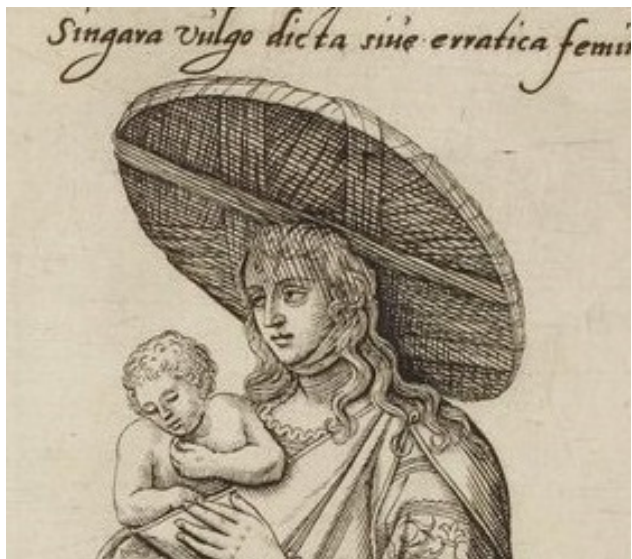
Imaxe 6: Detalle del grabáu anterior

ra qu'acompañaba a las cantaderas fai referencia a la sua función como personaxe al que por un preciu se-y encargaba despregar una actuación individual mui marcada, característicamente alegre, que precedía a la comitiva conos bailles y movimientos qu'excutaba.