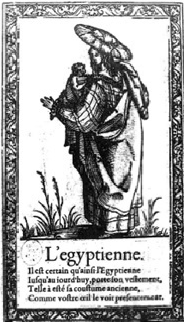
Imaxe 3: “L’egyptienne”, grabáu del libro de François Desprez Recueil de la diuersité des habits, qui sont de present en vsage, tant es pays d’Europe, Asie, Affrique & Isles sauvages, Le tout fait apres le naturel (1567: [147])

capiti imponunt mulieres”) (Torrione, 1995: 29-31; Rodríguez Hernández, 2019: 70-71 y ss.).