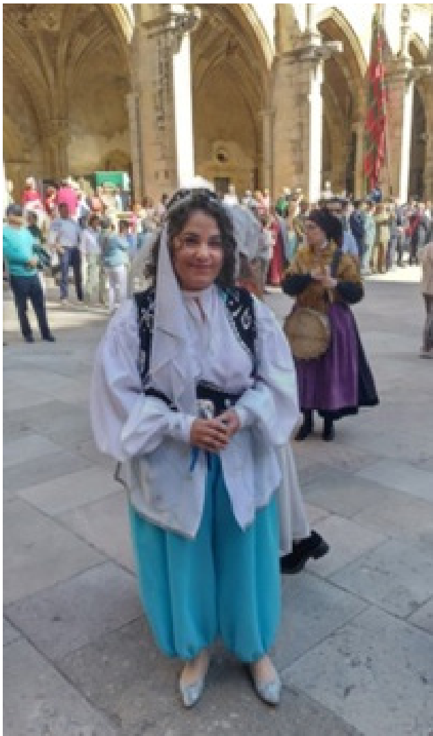
Imaxe 7: La sotadera na cerimonia de las cantaderas. Llión, 2 d'outubre del 2022.

mente pa servir a los intereses del mitu xacobéu, tan necesariu pa caltener las rentas que cobraba la iglesia compostelana a través del votu de Santiago. La existencia y el caltenimientu d'esta tradición folclórica lionesa convirtiéronse nuna firme xustificación de la realidá histórica d'un privilexu falsificáu, base documental del fraude compostelanu.