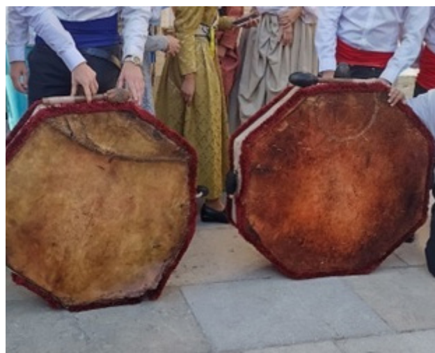
Imaxe 2: Atabales empreaos actualmente na cerimonia de las cantaderas. Llión, 2 d'outubre del 2022.

El día 16 d'agostu, al amanecerín, diba hasta la catedral el corredor de Llión cona caballería,