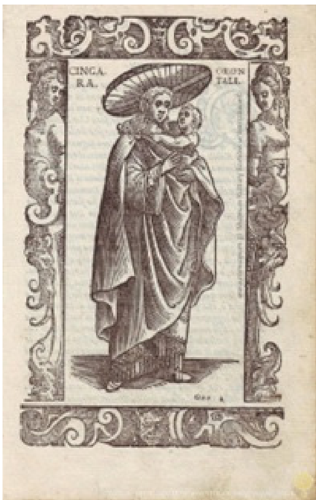
Imaxe 4: "Cingana orientale, overo donna errante", grabáu del llibru de Cesare Vecellio Degli abiti antichi, et moderni di Diuerse Parti del Mondo (1590: 466 r.-466 v.)

la ciudá y pidieron ser admitíos pa baillar n'honor del sacrificiu de Cristo, cumo yera costume.