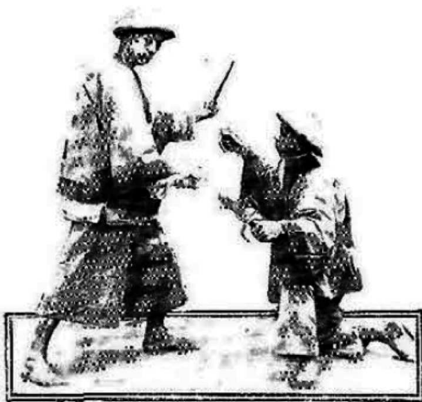
Soldados chinos en la esgrima de machetes.