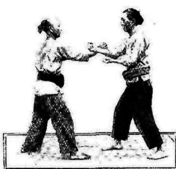
Luchadores chinos comenzando el combate