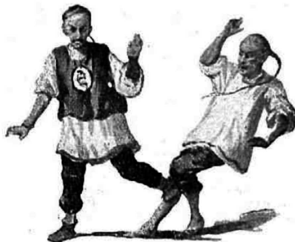
LA COZ EN LA ESPINILLA