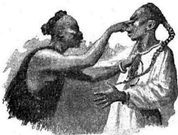
EL GOLPE PARA CEGAR Y AROGAR

ses demuestran mayor destreza y arte que los chinos en ese ejercicio". La fotografía que acompaña al texto, en este caso, muestra a dos practicantes en posición de inicio de combate. En ambas imágenes, los luchadores visten indumentarias tradicionales chinas (véanse las imágenes del Grupo 2).