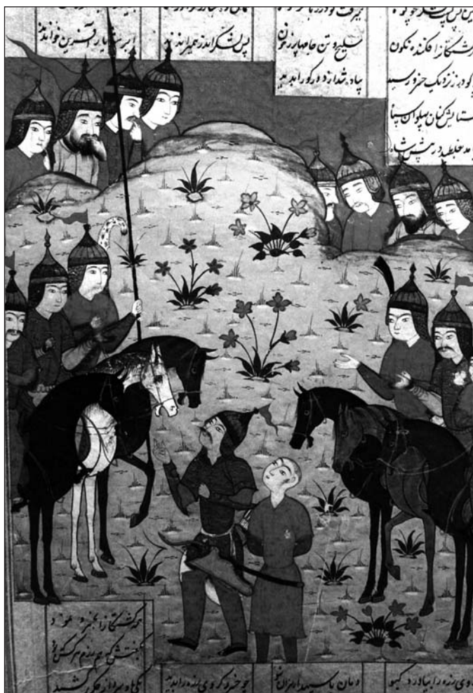
MINIATURA DE UN MANUSCRITO DE ŠĀHNĀME-YE ŠĀH MAHMUD , DEL S. XVI, MOSTRANDO A UN CABALLERO ARMADO CON UNA LANZA LARGA DE CABALLERÍA.

Tras la conquista musulmán de Irán (651 d.C.), la lanza mantuvo su importancia como el arma principal de batalla. Los manuscritos persas citan diferentes tipos de lanzas y jabalinas que se utilizaban durante las mismas, e igualmente describen diferentes métodos para templar la hoja de lanza, como el manuscrito Bayān al-Sanā'āt (Taflisi, 1975/1354:339), que describe que para templar una hoja de lanza que causa heridas negras -esto es, graves- y mate al enemigo, se tienen que tomar huevos de avispas y abejas y quemarlos, para después mezclar el producto resultante con sangre de burro, agua, y llevarlo a ebullición. Después la hoja de lanza se templea en este líquido para lograr el mortífero resultado. Los manuscritos persas también describen otros detalles, como el manuscrito Ādāb al-Harb va al-Šojā-e (Mobārak Šāh Faxr-e Modabbar, 1967/1346:261), que señala que para el asta de lanza se usaba la madera de sauce, o el Dārābnāme (Beiqami, 2002/1381:623; vol.1), que cita que también se utilizaba acero hueco para el asta.