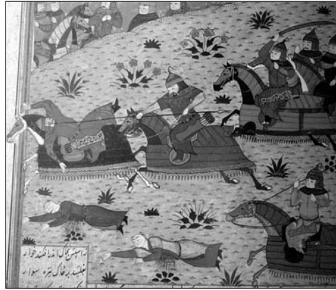
LA MINIATURA “ABU AL-MIHJAN EN LA BATALLA”, DE UN MANUSCRITO DE XĀVARĀNĀME DEL S. XV, MUESTRA AL GUERRERO DE LA DERECHA UTILIZANDO LA TÉCNICA NEYZE BAR ČEŠM ZADAN (GOLPEAR EL OJO CON LA LANZA).

sión neyze be dast zadan (golpear la mano con la lanza). También se atacaban los hombros, como refiere el manuscrito Abu Moslemnāme , del s. X (Tartusi, 2001/1380:113; vol. 4), con la expresión neyze bar kefz zadan (golpear el hombro con la lanza).