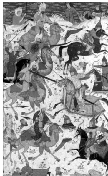
ABAJO IZQUIERDA: MINIATURA “LA BATALLA DEL EJÉRCITO DE BIJAN CON YAZDGERD”, DE UN MANUSCRITO DE ŠĀHNĀME DEL S. XVI, EN LA QUE SE MUESTRA AL GUERRERO DE LA DERECHA UTILIZANDO LA TÉCNICA “ATACAR EL PECHO CON LA LANZA”.