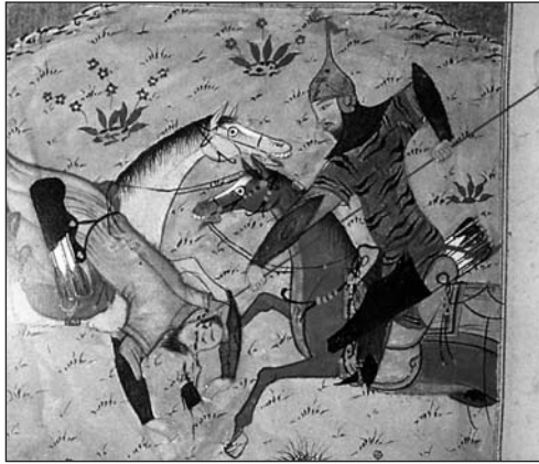
LA MINIATURA “LA LUCHA DE ROSTAM CON ALKUS, COMANDANTE DE TURÁN”, DE UN MANUSCRITO DE ŠĀHNĀME DEL S. XV, MUESTRA A ROSTAM ASESTANDO UNA LANZADA A LA CABEZA DE ALKUS APLICANDO LA TÉCNICA “ATACAR LA CABEZA CON LA LANZA”.