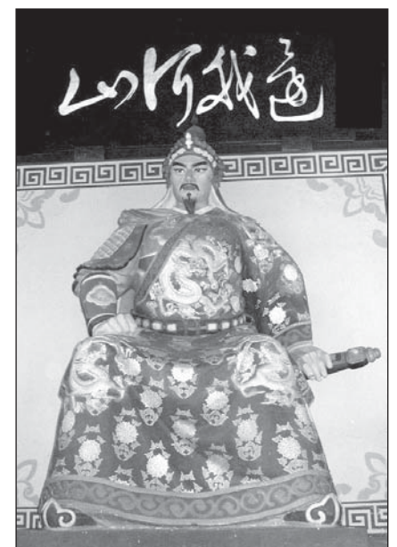
Estatua de Yue Fei en el templo de Yue Fei. La caligrafía en la mano de Yue Fei dice “devuelve nuestros ríos y montañas”.

Los Manchú eran descendientes de los fundadores Yurchen de la Dinastía Jin (1115-1234), contra los que luchó Yue Fei y, en 1616, Nuranchi (1559-1626), fundador del estado Manchú que finalmente conquistó China,