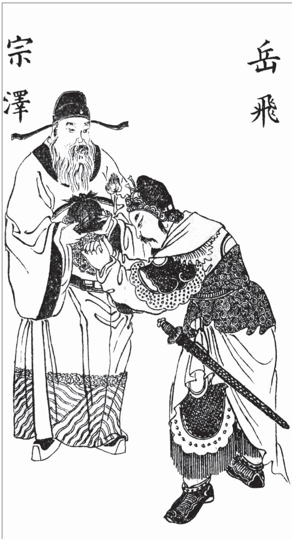
Yue Fei rindiendo homenaje al veterano oficial de asuntos militares Zong Ze. Esta ilustración proviene de la Historia patriótica completa e ilustrada de Yue Fei (1912), escrita por Qian Cai.