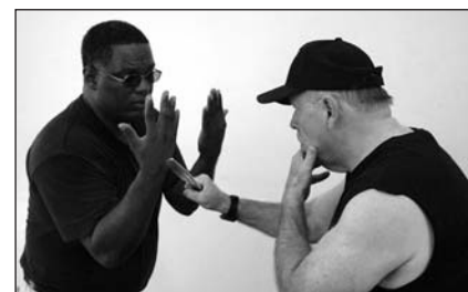
La forma correcta de enfrentarse a un adversario con un cuchillo: las muñecas giradas hacia el interior, con el dorso de las manos frente al arma del oponente.