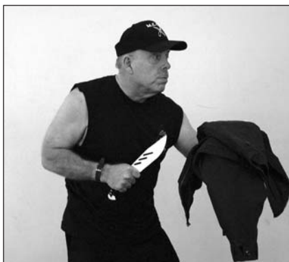
Uso de una chaqueta para proteger la mano libre en la posición de cuchillo en mano retrasada.

de desarme. Algunos defensores de esta postura recomiendan enrollar el brazo delantero con una chaqueta (Ryan, 1999: 37-44; Applegate, 1993: 11-12; Pentecost 1988: 20-21; LaFond, 2001: 131-146).