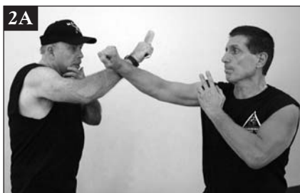
2A) Bloqueo externo defensivo contra un ataque de cuchillo. 2B) Empujando hacia el interior el codo del brazo que bloquea, el cuello se expone a un corte inmediato con el cuchillo.