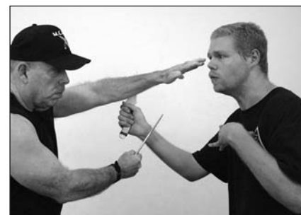
Meter los dedos de la mano libre en los ojos del oponente mientras se corta sus muñecas con el cuchillo, que está en la otra mano.

Los estudiantes de artes marciales deberían ser adiestrados para mantener su mano libre en una posición de guardia al atacar y, si el defensor está dentro del alcance de la mano libre en cualquier momento de la práctica de una técnica, golpear al defensor con ella para hacerle consciente de su posición insegura. Durante la práctica de técnicas de desarme de cuchillo en el dojo es recomendable que el atacante tenga un cuchillo de entrenamiento en cada mano para que quede claro al defensor la necesidad de ser consciente en todo momento de la mano libre del adversario así como de la mano atacante.