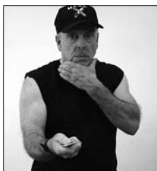
Ángulo 3, lateral palma hacia arriba, corte al abdomen.