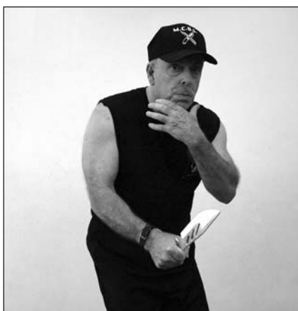
Posición de combate con el filo hacia arriba.

Un luchador de cuchillo puede a veces ocultar un arma abierta en la mano que sujeta el arma, o detrás de la otra mano o brazo, o detrás de