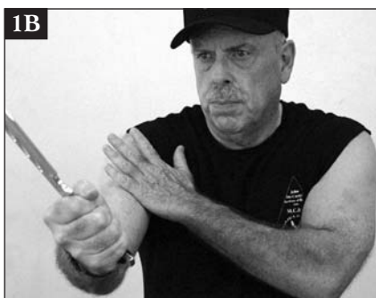
Uso de la mano libre para apoyar el brazo armado a nivel de la muñeca (1A) y del brazo (1B).