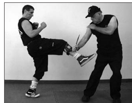
Golpe gunting con el pomo del cuchillo al bíceps y a la espinilla del oponente.