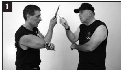
Doble-sinawali (entrecruzando): ejercitación de dos personas con un cuchillo en cada mano.

Si el entrenamiento se realiza con un cuchillo en una mano, cada adversario golpea el arma del otro con su cuchillo y da manotazos a la palma del otro con su mano abierta. Esto enseña a cada estudiante cómo insertar la mano entre los ataques con cuchillo del otro y les prepara para golpear al adversario con el puño o con la mano abierta como un movimiento