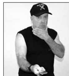
Ángulo 5, estoque directo al abdomen.