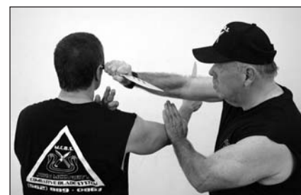
Golpeando a la sien del oponente con el pomo del cuchillo.

Un artista marcial desarmado enfrentándose a un luchador con cuchillo debe poder pelear en todas las distancias y cambiar libremente de una a otra. El artista marcial debe asimilar qué técnicas funcionan y cuáles no en cada distancia cuando el adversario tiene un arma. Por ejemplo, la evasión o la esquivas con una mano funcionan en la distancia larga, pero no en la intermedia o corta ya que el adversario está demasiado cerca. Uno también debe saber cómo continuar con la mano libre para esta a salvo del arma del oponente.