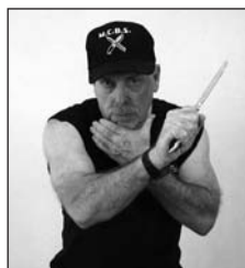
Ángulo 2, diagonal palma hacia abajo, corte a la garganta.