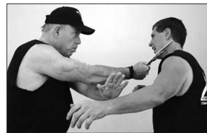
Uso de la mano libre para desviar el movimiento defensivo del oponente mientras se corta con el cuchillo.

En la práctica de la defensa contra un atacante armado con un cuchillo, el mejor procedimiento es dar por supuesto que el atacante tiene al menos dos cuchillos, uno en cada mano, o uno con el que se inicia el ataque y otro escondido en una posición desde donde puede ser sacado instantáneamente con la mano libre. Es crucial que todas las técnicas de desarme sean diseñadas y ejecutadas de tal modo que el cuerpo de quien se defiende esté siempre en un ángulo correcto y a una distancia relativa al atacante a fin de que el defensor esté a salvo, no sólo del cuchillo de la mano atacante del adversario, sino también de su mano libre.