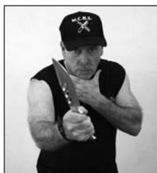
Ángulo 1, diagonal palma hacia arriba, corte a la garganta.