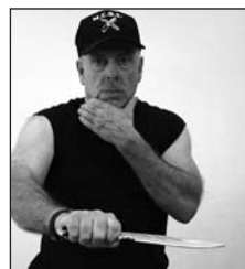
Ángulo 4, lateral palma hacia abajo, corte al abdomen.