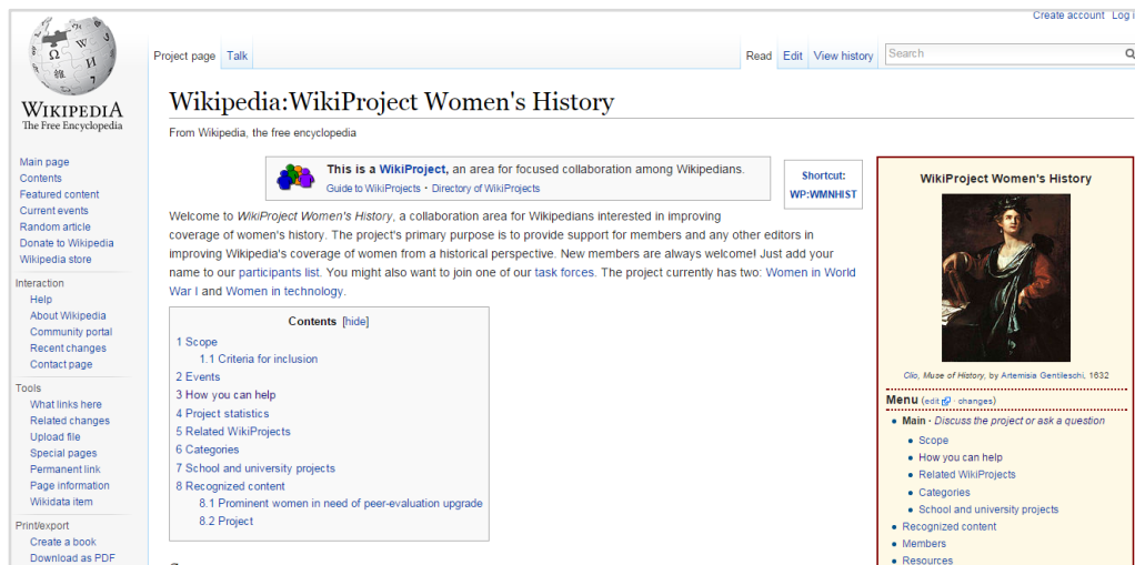
Figura 4. Home do WikiProject Women's History