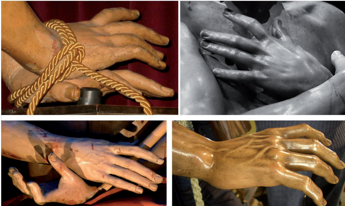
▪ Fig. 8. De izquierda a derecha. Manos del Cristo atado a la columna, del Ecce Homo , del Cristo coronado de espinas y mano derecha del Nazareno. Fotografías: Dondepiedad , anónima, anónima y de los autores.