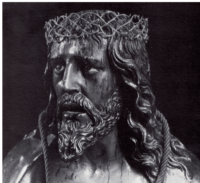
▪ Fig. 3. Gregorio Fernández: Cristo coronado de espinas. Iglesia de la Santa Vera Cruz, Valladolid. H. 1619.