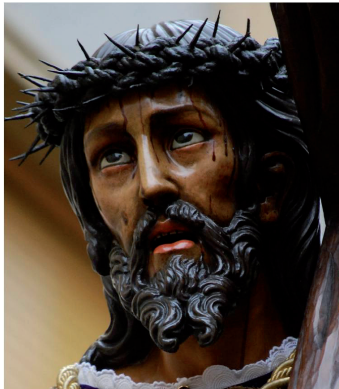
▪ Fig. 5. Nuestro Padre Jesús Nazareno. Iglesia de Santa Nonia. León.