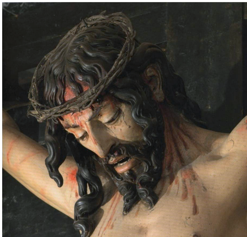
▪ Fig. 9. Gregorio Fernández: Cristo crucificado. Zaratán.