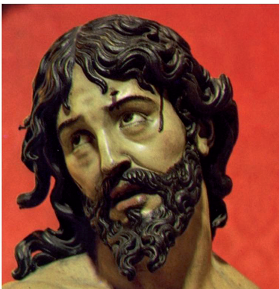
▪ Fig. 10. Gregorio Fernández. Cristo atado a la columna. Valladolid. H. 1615 (izqda.) y Ecce Homo (dcha.). Museo Diocesano de Valladolid. H. 1620.