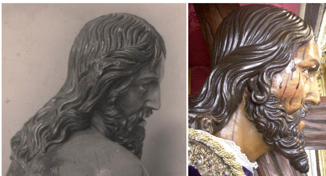
▪ Fig. 7. Perfil derecho del Cristo atado a la columna (dcha.) y del Nazareno (dcha.).