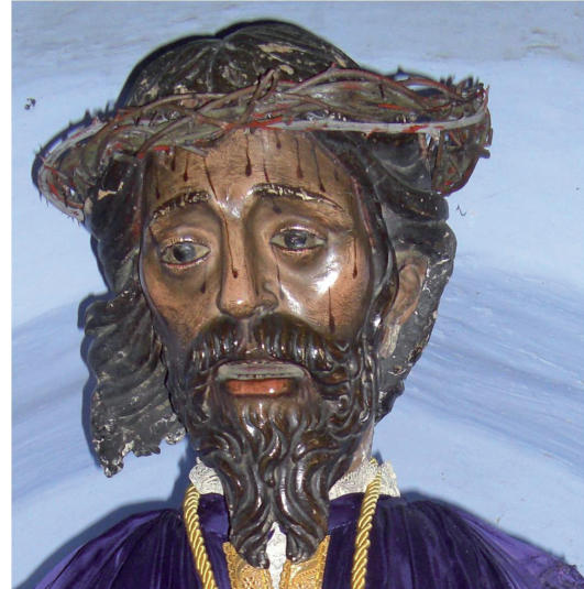
▪ Fig. 2. Pedro de la Cuadra: Jesús Nazareno. Grajal de Campos. 1623.