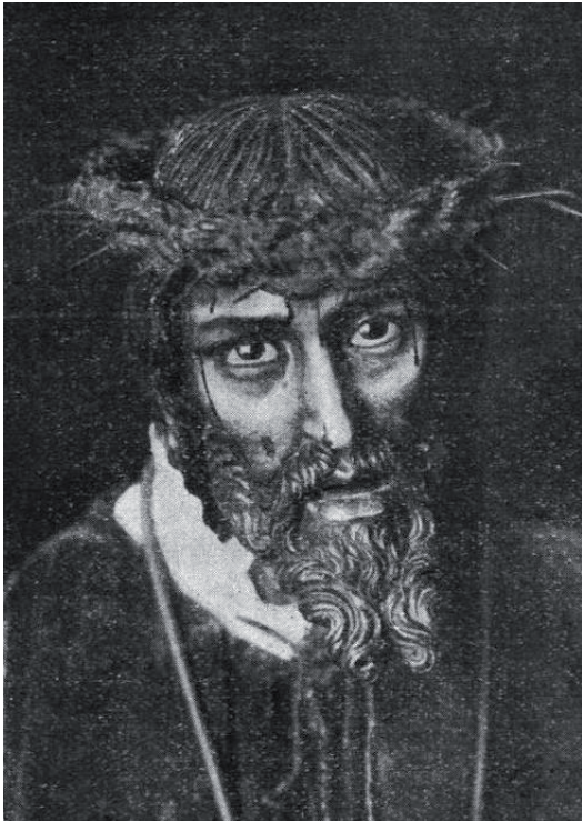
▪ Fig. 1. Nuestro Padre Jesús Nazareno. Revista Semana Santa , 1928.