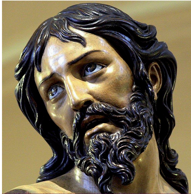
▪ Fig. 4. Gregorio Fernández: Cristo atado a la columna. Iglesia de la Santa Vera Cruz. Valladolid. (A. 1619).