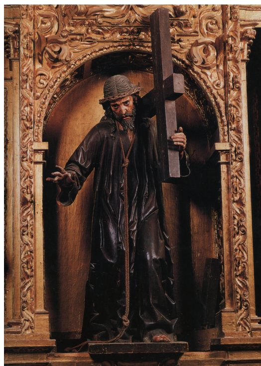
▪ Fig. 12. Atribuido a José de Rozas. Nazareno. San Cebrián de Campos.