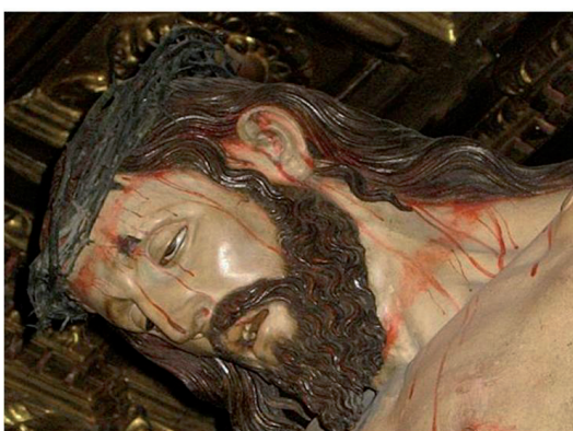
▪ Fig. 11. Gregorio Fernández: Cristo de la luz. Valladolid. 1631. Cristo de los Balderas. Iglesia de San Marcelo. León. 1631.