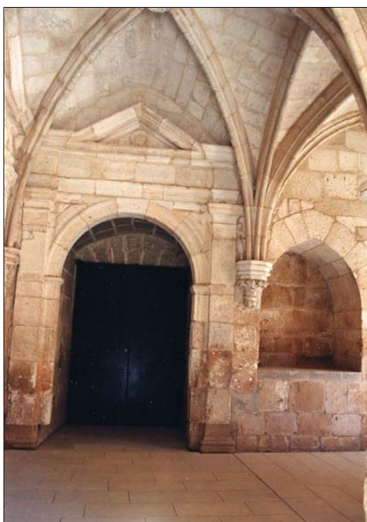
■ Lám. 9. Santa María de Huerta. Panda del Capítulo, vano junto a la Sala de Profundis , sepulcro nº 6.