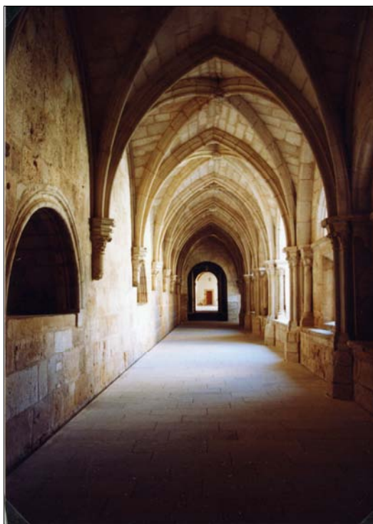
■ Lám. 11. Santa María de Huerta. Panda del Mandatum, sepulcros nº 12 y 11.