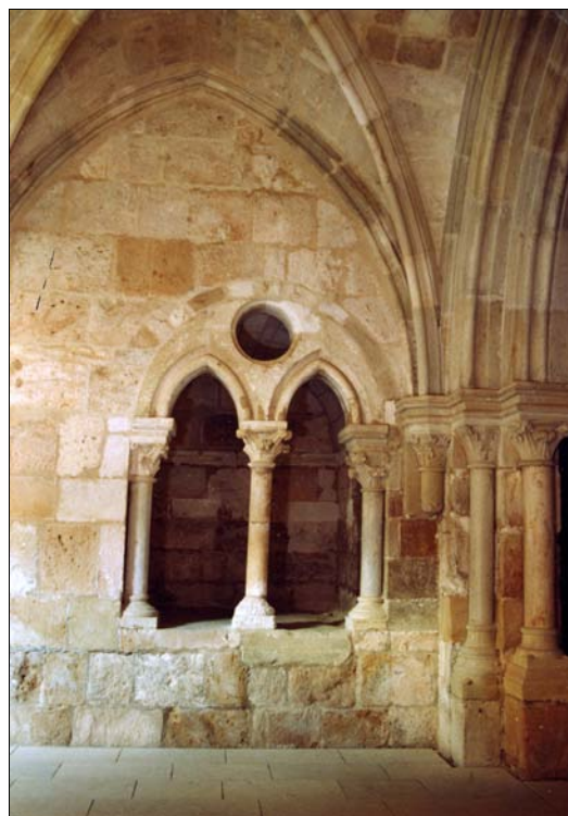
■ Lám. 6. Santa María de Huerta. Panda del Capítulo, antiguo armariolum , sepulcro nº 1.