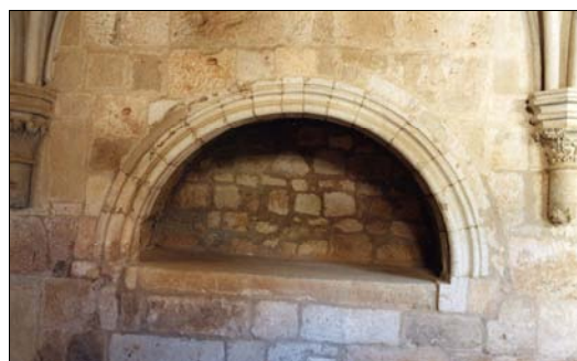
■ Lám. 12. Santa María de Huerta. Panda del Mandatum, detalle sepulcro nº 12.