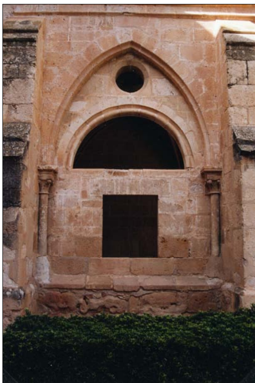
■ Lám. 5. Santa María de Huerta. Intercolumnio cegado del claustro.