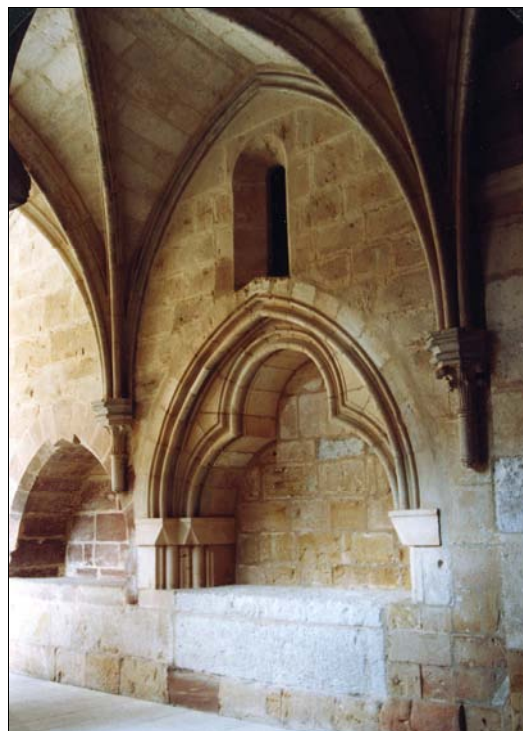
■ Lám. 10. Santa María de Huerta. Panda del Refectorio, sepulcros nº 8 y 9.