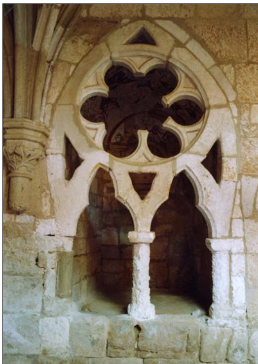
■ Lám. 7. Santa María de Huerta. Panda del Capítulo, sepulcro nº 2.