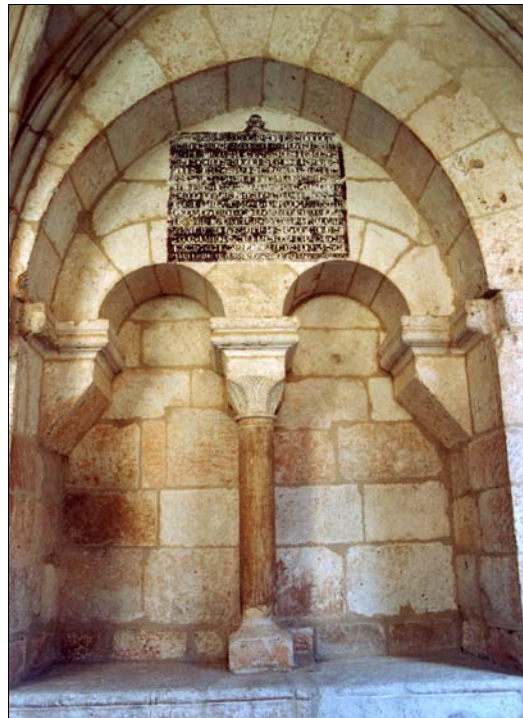
■ Lám. 8. Santa María de Huerta. Panda del Capítulo, ventana Norte de la Sala Capitular, sepulcro nº 5.