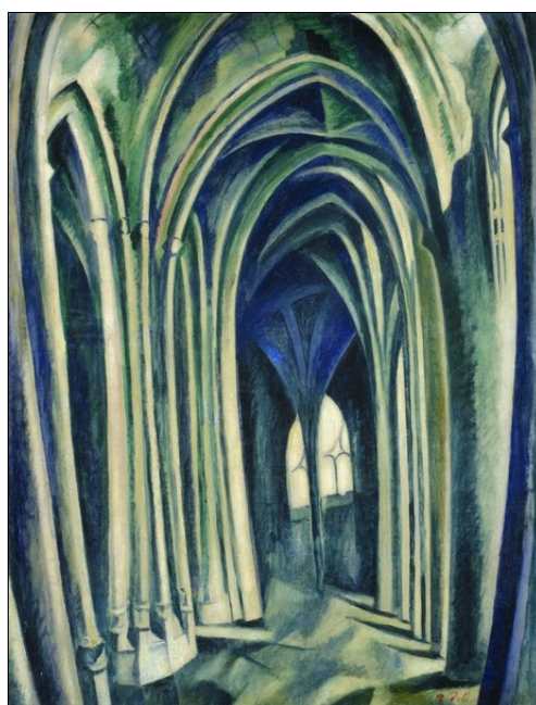
■ Ilustr. 4. R. Delaunay, Saint Séverin , 1911.