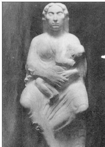
■ Ilustr. 6. F. Asorey, Mater , ca. 1916 (Tomada de R. OTERO TÚÑEZ, “O escultor Asorey. Vida e Obra”, Centenario Francisco Asorey , Santiago de Compostela, 1989).