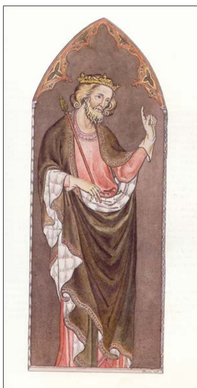
■ Ilustr. 7. W. Blake, Rey Sebert , ca.1775.