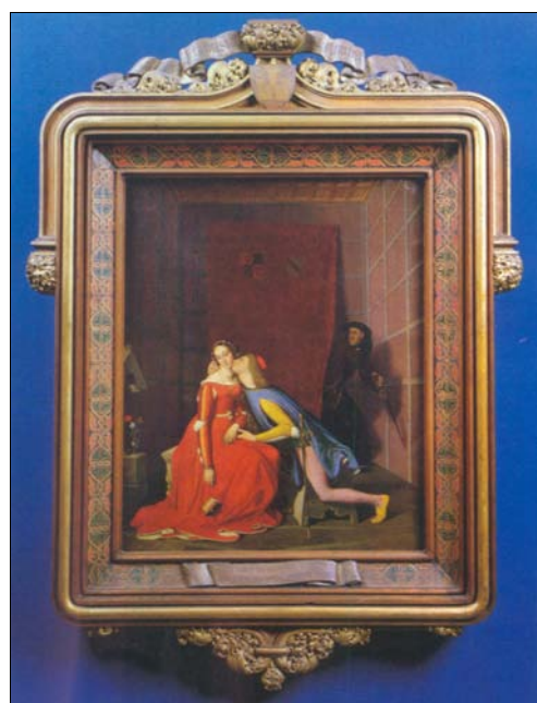
■ Ilustr. 8. J. D. Ingres, Paolo et Francesca , 1819.