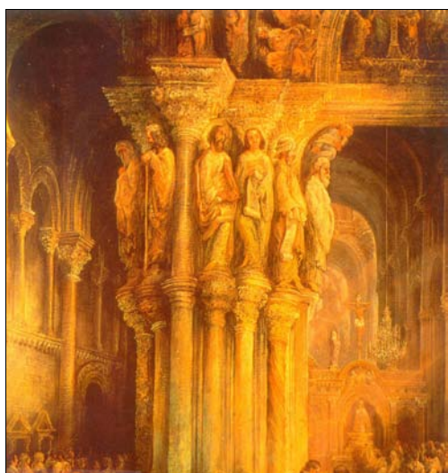
■ Ilustr. 3. J. Pérez Villaamil, Pórtico de la Gloria (detalle) , 1849-1851.