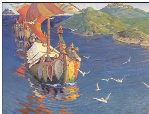
■ Ilustr. 2. N. Roerich, Los visitantes de tierras lejanas , 1901.