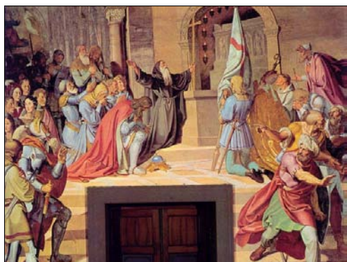
■ Ilustr. 1. J. Führich, Los cruzados ante el Santo Sepulcro , 1825.