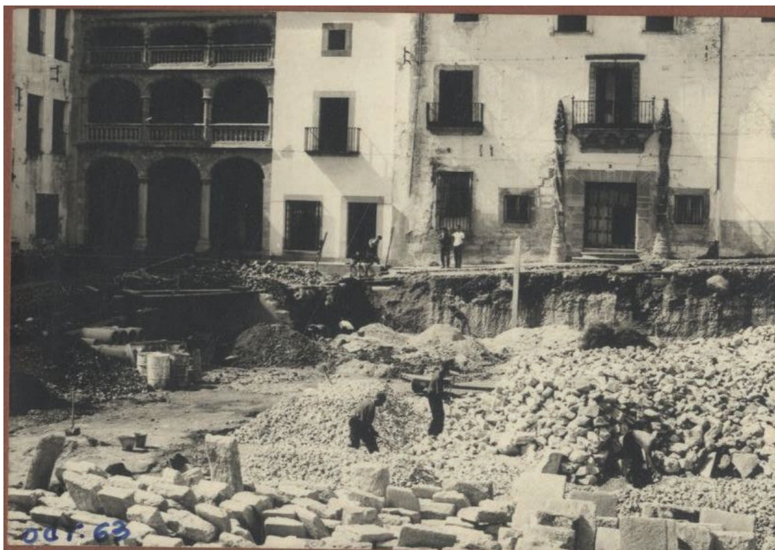
▪ Fig. 5. Aspecto del lado suroccidental durante las obras de demolición del mercado en 1963.

con afectación de una de las fachadas del palacio del Marqués de la Conquista.