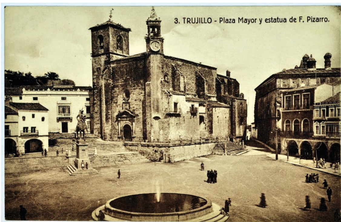
▪ Fig. 4. Ángulo nororiental de la plaza con la iglesia de San Martín en primer término y al fondo el palacio de San Carlos con la galería de ventanas aún cegadas anterior a 1960.

te en el pavimento, muy desnivelado y con acusadas pendientes de terreno que había que salvar en algunas zonas (Fig. 4). El estado de conservación de los pavimentos y los distintos elementos de fábrica también dejaba mucho que desear, especialmente en los soportales próximos a San Carlos.