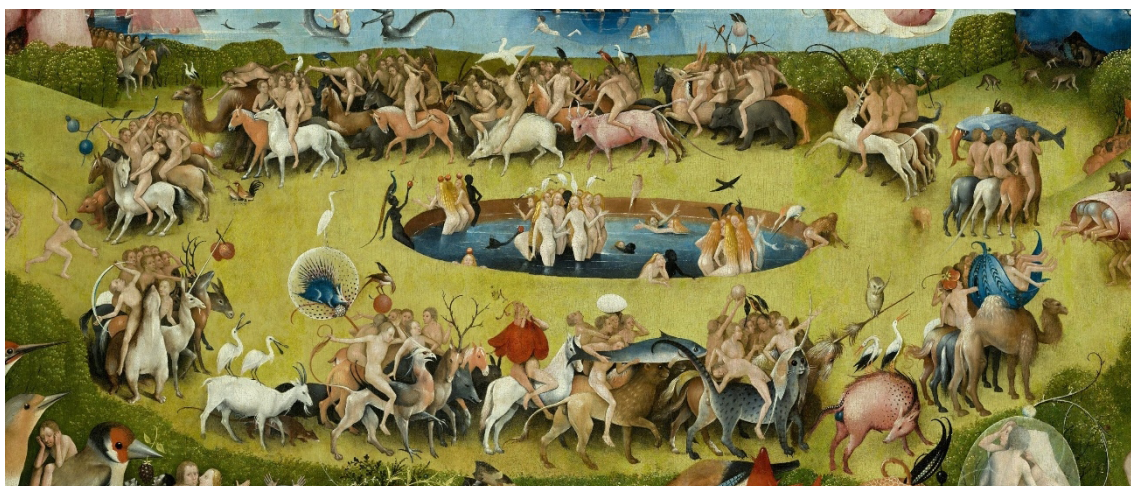
▪ Fig. 5. El Bosco. El Jardín de las delicias . Detalle del panel central: Museo Nacional del Prado.

relacionar también el estanque en el panel central de El jardín de las delicias que pintó El Bosco con la estructura que posteriormente adoptó la obra del cubano. Sin embargo, en lugar de un carnaval –como se presenta en la obra areniana–, en la de El Bosco aparece una cabalgata fantástica de animales enormes que sobrepasan en tamaño a los seres humanos que los montan: “Dejo a la