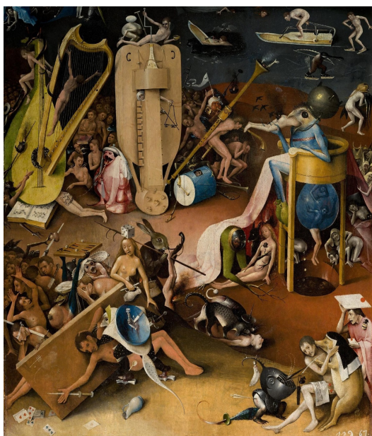
▪ Fig. 6. El Bosco. El Jardín de las delicias . Detalle del panel derecho (Infierno y Apocalipsis): Representación del Demonio sentado, engullendo a los condenados al Infierno. Museo Nacional del Prado.

plagas, hipocresías, huesos y dientes de tiburones 50 .