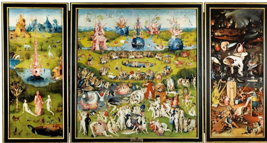
▪ Fig. 1. El Bosco. Tríptico de El Jardín de las delicias . Museo Nacional del Prado.