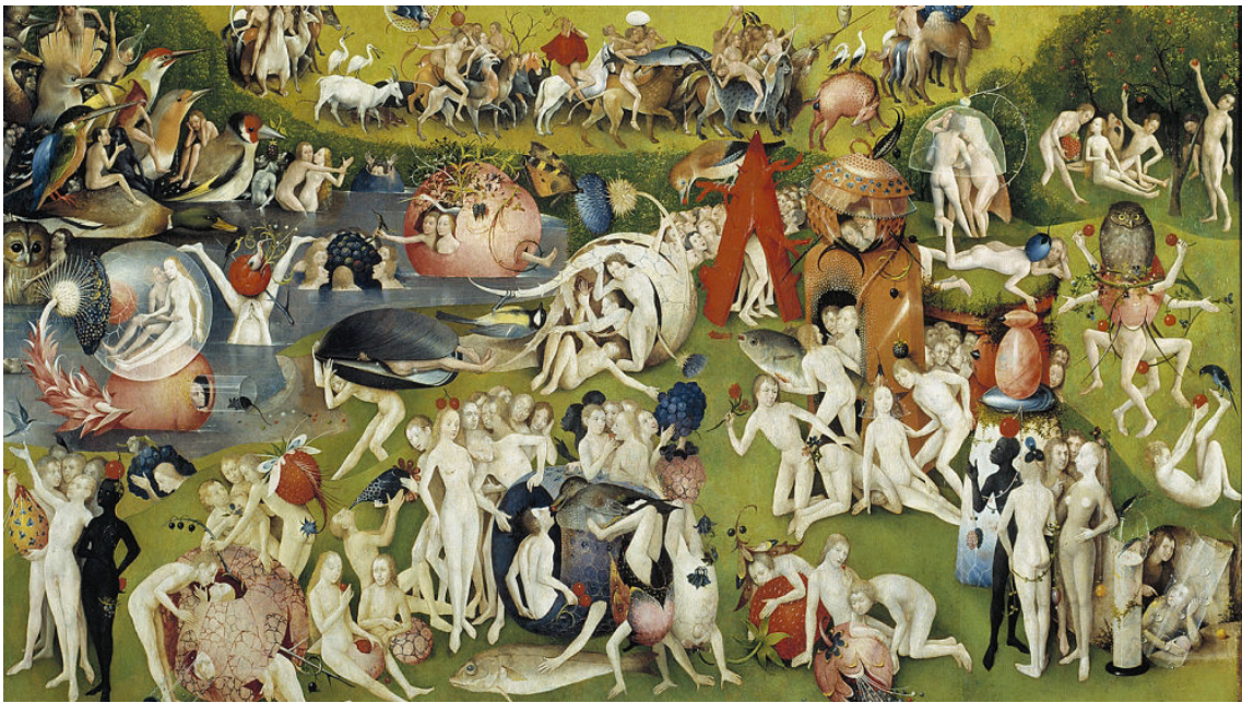
▪ Fig. 8. El Bosco. El Jardín de las delicias . Detalle del panel central. Museo del Prado.

la cultura en una ciudad que albergaba esos tesoros en un recinto clausurado y sin uso. El convento recibe de vuelta y transformados, algunos de los objetos que facilita, puesto que la exposición de Clara será posible gracias a las sábanas de lino y tapices extraídos del lugar, sobre los que Clara pintará su obra, incluyendo El color del verano . Arenas configura así un palimpsesto al sobreponer textos neobarrocos –los suyos– sobre textos barrocos –antiguos tapices del convento–, apropiaciones artísticas –la obra de El Bosco– y fluencia del barroco por las calles de La Habana, en un juego de imágenes que activa el dinamismo barroco.