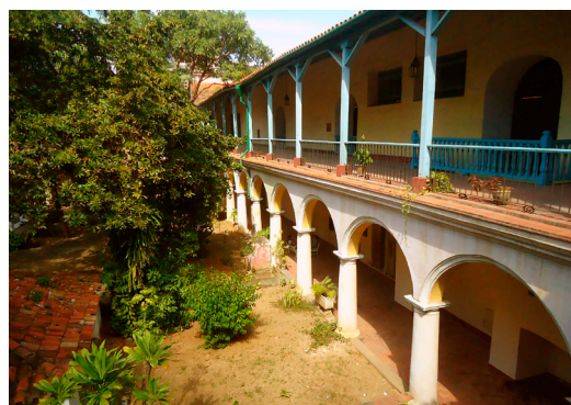
▪ Fig. 7. Convento de Santa Clara (La Habana). Patio Interior.

Resulta curiosa la descripción del convento (Fig. 7) en el que Clara expone su obra, al ser descubierto por amigos y vecinos casualmente: “Era un universo monumental y detenido en el tiempo donde no había que pedir permiso para echar a correr y donde finalmente, Mahoma, [...] comenzó a taconear sobre unas baldosas y azulejos medievales que cubrían los restos de la primera madre superiora [...]” 66 . Ese sitio en el que no había que pedir permiso para salir corriendo demuestra el grado de libertad que posee para exponer la obra; taconear sobre la tumba de la superiora es una forma de llamar al pasado dentro de aquella realidad cerrada, o bien la anticipación del acto contestatario que tendrá lugar allí. Uno de los vecinos de Arenas advierte: “Esto es una verdadera mina [...]; aunque era imposible hacer un inventario de todo lo que durante siglos las monjas habían acumulado pacientemente y habían tenido que abandonar en menos de veinticuatro horas. Cada uno empezó a inspeccionar los diversos corredores, los salones, las capillas, las celdas, los dormitorios colectivos, la gran biblioteca, el refectorio, la sacristía, los inodoros y los mil y un compartimentos que allí había, extasiándose ante un tapiz [...], un cuadro religioso, un abanico