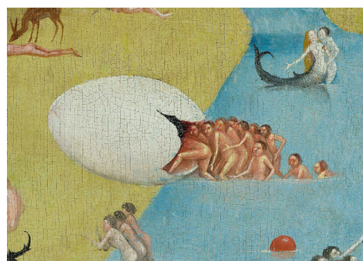
▪ Fig. 12. El Bosco. El Jardín de las delicias . Detalle del panel derecho (Infierno y Apocalipsis): Un huevo roto al que van a refugiarse los hombres. Museo Nacional del Prado.

conclusivas, especialmente la del primero de ellos para evaluar la misma, que califica como “un cosmos resuelto”. Ello evidencia que, como ocurre también en determinadas exposiciones “[...] se produce un diálogo entre el arte y el pensador profesional en el que el arte tiene su propio poder para hablar y responder” 83 .