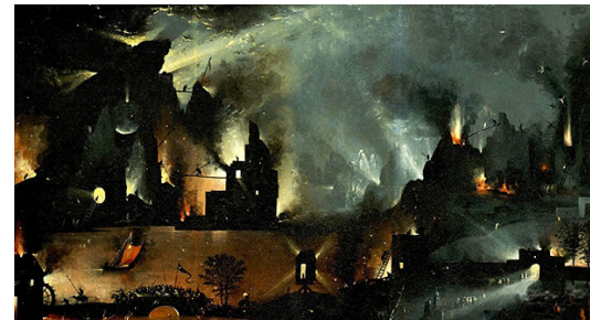
▪ Fig. 11. El Bosco. El Jardín de las delicias . Detalle del panel derecho (Infierno y Apocalipsis). Museo Nacional del Prado.

deteriorada, estaré yo o mi doble [...]” 77 . Reprodujo aquí escenas trastocadas del panel derecho de El jardín de las delicias para componer su novela/pintura. Mientras en el cierre de la obra original de El Bosco hay