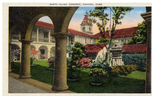
▪ Fig. 9. Interior del Convento de Santa Clara (La Habana). Postal de inicios del siglo XX. Impresores Hauser y Menet (Madrid).

Resulta curioso que aun cuando Clara no hubiese podido visitar museos de relevancia en el extranjero (Arenas sí, en 1990) pudiese ejecutar importantes obras artísticas: "Todos deambulaban por entre aquellas telas [...]. Algunos lloraban en silencio. El universo completo –por lo menos el universo de Clara Mortera– con todas sus visiones, mitos, terrores y éxtasis había llegado a una eclosión final. La pintora no había podido visitar nunca el Museo del Prado, ni el de los Uffizi, ni el Louvre [...]. Sin embargo, en aquel hueco mal iluminado se exhibieron aquella noche cuadros muy superiores a las obras que cuelgan permanentemente en los