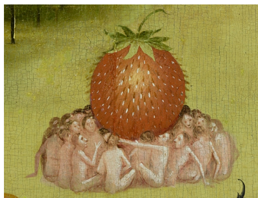
▪ Fig. 2. El Bosco. El Jardín de las delicias . Detalle del panel central: Personas en torno a una fruta roja desproporcionada que le sirve de referencia. Museo Nacional del Prado.

evidencia que, aunque el cuadro de Clara se convierte en irreverencia artística, crítica y denuncia, preserva la imaginación como recurso para comunicar su mensaje.