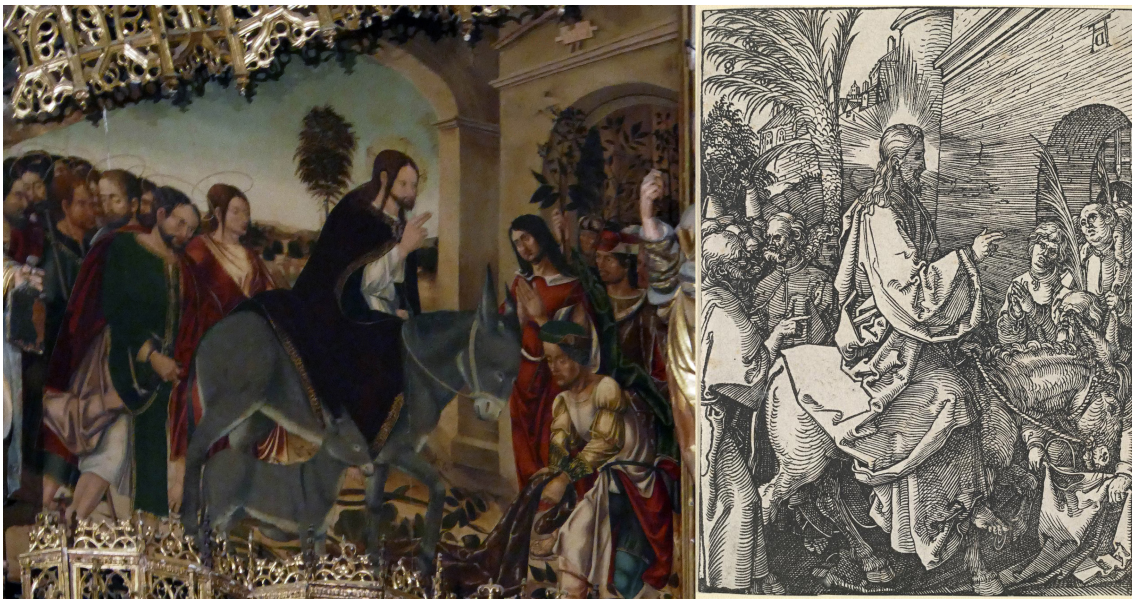
▪ Fig. 8. Entrada de Jesús en Jerusalén. Retablo mayor de Santillana del Mar. Alberto Durero. Entrada de Cristo en Jerusalén, serie de la Pequeña Pasión (ca. 1507-1513).