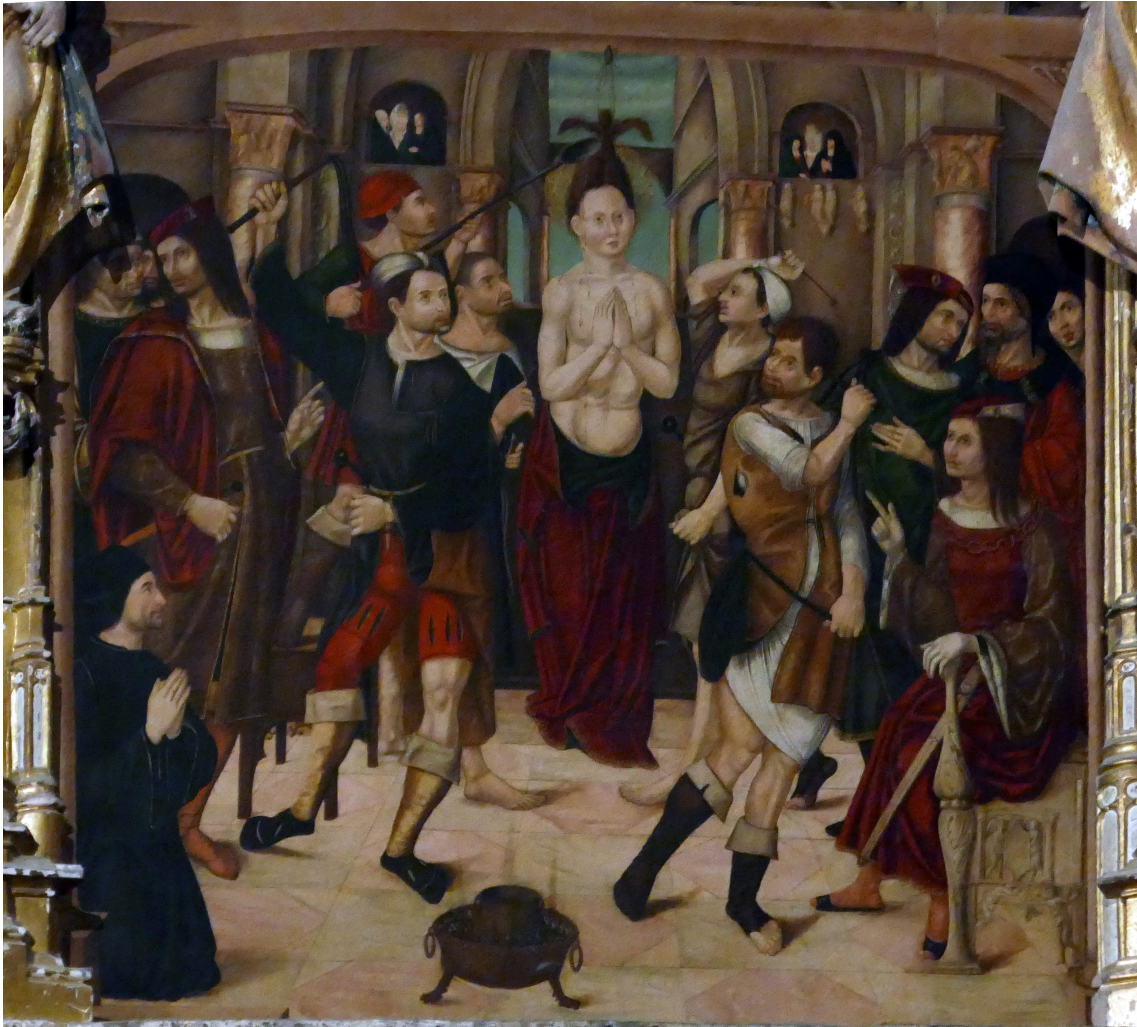
▪ Fig. 7. Martirio de Santa Juliana. Retablo de Santilla del Mar.

ocasiones acuchilladas, a veces sobre cofias (que también se pueden ver exentas entre las vestimentas de las clases populares –San José–). Los sayones van vestidos a la tudesca, con calzas, compuestas de muslos ajustados, con acuchillados, y medias con zapatos escotados y chatos 28 . También ha de destacarse el hecho de que la mayor parte de los personajes de apostura nobiliaria muestran todavía melenas largas, peinado que, como se recoge en la crónica de Sandoval 29 , estuvo