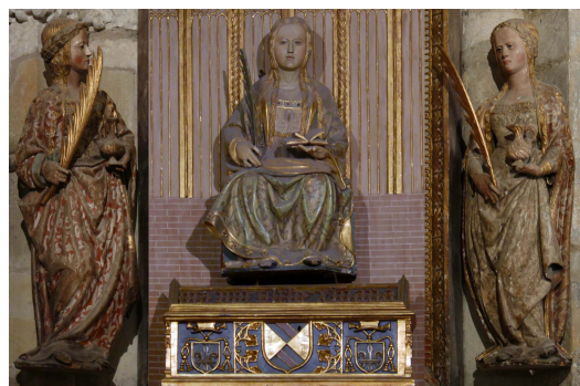
▪ Fig. 5. Santa Juliana, flanqueada por las imágenes de Santas Justa y Rufina. Retablo mayor de Santillana del Mar.

los Reyes. Sin embargo, la comparación detallada de las pinturas nos descubre en Santillana a un artista más cuidadoso en la descripción de los detalles anatómicos, en el plegado de los ropajes o en la definición del espacio perspectivo, las arquitecturas y la indumentaria, aunque algo más duro en la definición de los perfiles. Indudablemente, estamos ante artistas de un mismo taller, posiblemente burgalés, que realizan una síntesis progresiva, que parte de los modelos de Alonso de Sedano (Adoración de los Reyes Magos del retablo de las Reliquias de la sala capitular de la catedral de Burgos -1495- y pinturas del claustro de la catedral de Burgos -finales del siglo XV-), coincide con los de León Picardo y se acerca, incluso, a los tipos desarrollados por Andrés de Melgar (retablo del trascoro de Santo Domingo de la Calzada -ca. 1531-). No obstante, coincidimos con Post en señalar que ambos conjuntos pictóricos, asturiano y cántabro, deben ser posteriores a 1517, no sólo por la proliferación en Llanes, y aún más en Santillana, de fondos arquitectónicos clásicos, sino por la presencia de otros indicios, como la indumentaria de los personajes, que nos lleva a retrasar su ejecución, al menos en el caso de Santillana, hacia 1525-1535.