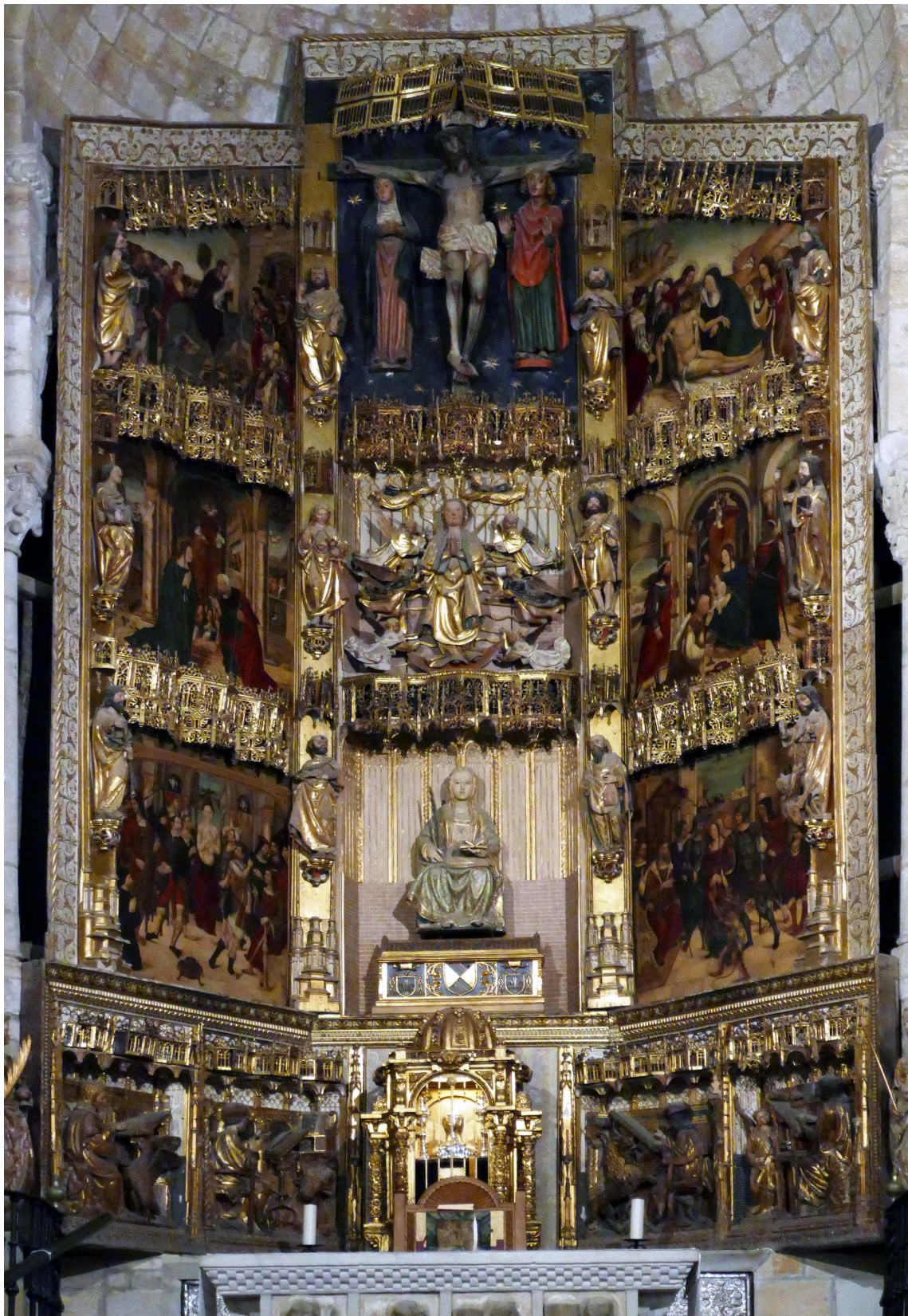
▪ Fig. 1. Anónimo (taller burgalés). Retablo mayor de la colegiata de Santa Juliana. Santillana del Mar (Cantabria). ca. 1530-1535.