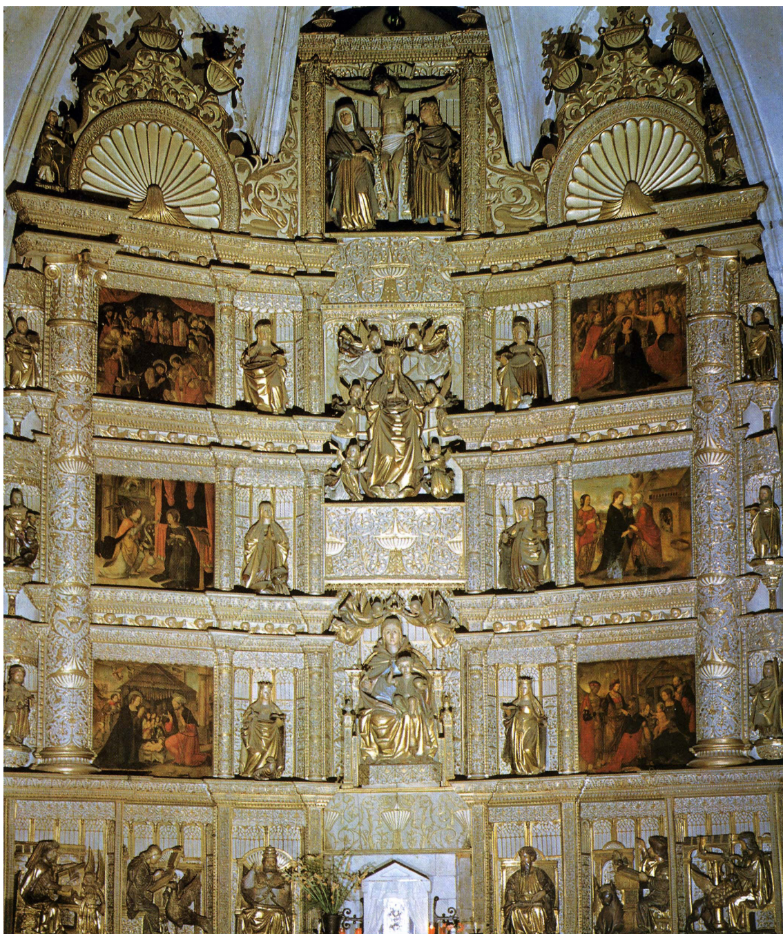
▪ Fig. 2. Maestro de Llanes. Retablo mayor de la colegiata de Santa María del Conceyu. Llanes (Asturias), posterior a 1517.

No obstante, como indica Isabel del Río, Bigarny en este decenio (1510-1520) “es capaz de hacer simultáneamente retablos diseñados a la romana, como el de San Bartolomé; otros, como el de Llanes, donde dibuja encasamientos góticos junto a columnas y entablamentos, y otros totalmente góticos como