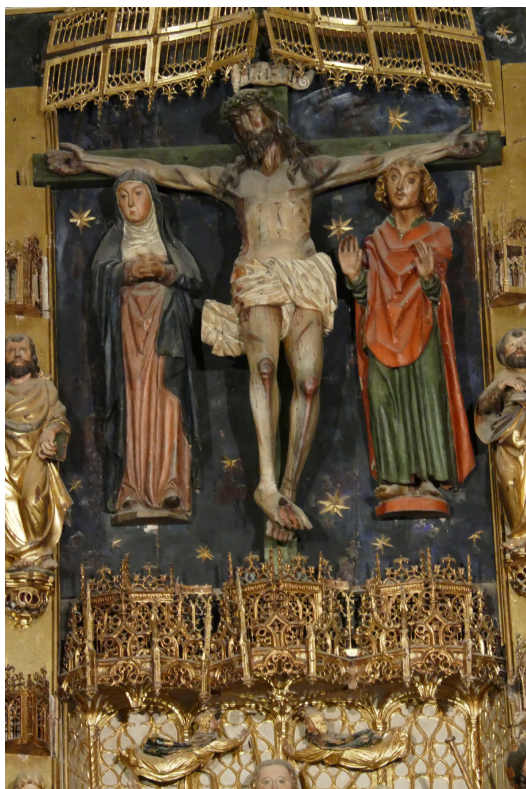
▪ Fig. 4. Calvario del ático del retablo mayor de Santillana del Mar.

recordar aquí que las dos imágenes de Santa Justa y Rufina, que hoy se exhiben fueran del retablo mayor de Santillana, formaron parte de su encasamento principal, flanqueando a la imagen de la mártir titular, Santa Juliana de Bitinia, tal como se indicaba en el inventario de 1606 (Fig. 5).