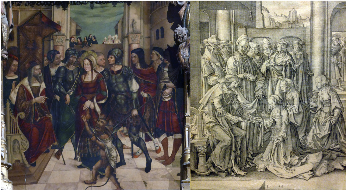
▪ Fig. 9. Juicio de Santa Juliana. Retablo mayor de Santilla del Mar. Lucas van Leyden, Esther y Asuero, 1518.

En la tabla del Martirio de Santa Juliana se sitúa, en actitud orante, un personaje vestido con ropa talar o sayo largo, de mangas anchas, tocado con un bonete o carmeñola, de terciopelo negro, posiblemente una indumentaria eclesiástica, pues creemos que representa a un abad benedictino. Concuera, por ejemplo, con el modelo de vestimenta que muestra el personaje anónimo pintado por Jan Polack, de un abad benedictino (1484) 32 . Geográficamente más cercana e igualmente comparable en su vestuario con nuestro promotor es la estatua orante de don Fernando de Llanes, pequeña pieza de madera tallada y policromada (70x40 cm.), datable hacia 1510-1517, representando a un canónigo de la catedral de Oviedo que ostentaba, además, el título de abad de Teberga, fundador de la capilla de la Natividad de Nuestra Señora en la catedral 33 . El