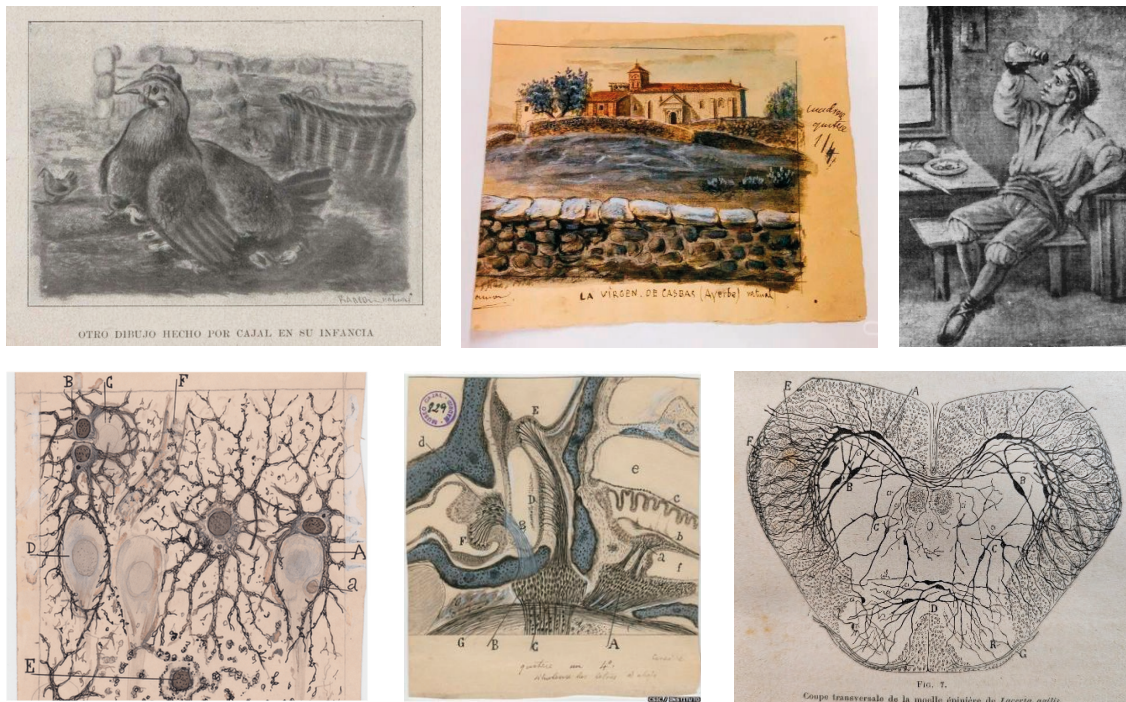
Figura 6. El dibujo fue la pasión permanente de Cajal. Algunos dibujos de su juventud (sup.) y algunas de sus representaciones científicas (inf.): astrocitos en el hipocampo del cerebro humano (Izqda.); laberinto del oído interno (centro); corte transversal de la médula espinal de Lacerta agilis (Dcha).