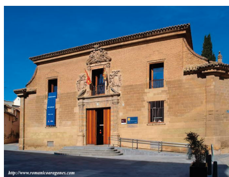
Figura 5. Instituto de Huesca donde Ramón y Cajal prosiguió sus estudios de bachillerato. Fotografía realizada por él mismo, edificio que fue la sede de la Universidad Sertoriana (Izqda.), y situación actual como Museo Arqueológico de Huesca (Dcha).