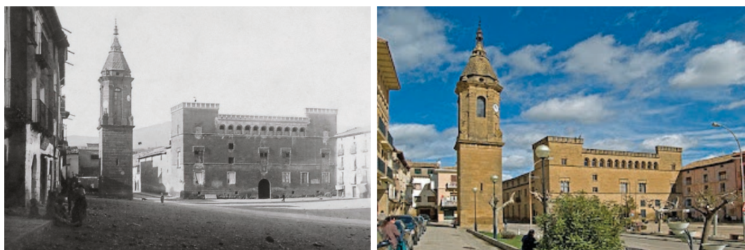
Figura 2. La torre del reloj y el palacio de Ayerbe en la villa del mismo nombre, considerada la patria chica de Cajal. Fotografía de Ramón y Cajal (Izqda.) y situación actual (Dcha.).

Los juegos de su época, en los que alcanzó una gran destreza, se han recordado en la exposición presentada en 2022 en el Palacio de Ayerbe ( Fig. 3 ). Esta muestra, organizada en su honor como contribución al 170 o aniversario de su nacimiento, tuvo como objetivo abordar los años que el premio Nobel pasó en la localidad y ayudar a entender cómo las experiencias vividas en la villa pudieron haber sido decisivas en la formación de su carácter y marcar su vida para siempre. Se recrea así ese periodo de la infancia de un niño al que familiarmente llamaban Santiagué. Relata él de sí mismo que en aquella época tomaba parte en los juegos del peón, del tejo, de la spandiella y del marro, además de las rutinarias carreras, saltos y peloterías espontáneas e inicuas, pero también algunas travesuras pueriles algo más arriesgadas y comprometidas, bajo el epígrafe de aventuras, como las contiendas a pedrada limpia, asaltar huertos, o ir a robar uvas, higos o melocotones. Trepaba árboles como un mono, brincaba como un saltamontes, corría como un gamo, subía paredes como una lagartija sin miedo alguno a las alturas, y fue un tremendo experto en palos, en flechas, no solo de buen alcance, sino también planteadas para obedecer fielmente a la trayectoria programada, y sobre todo en el diseño y manejo de la honda, que lo hacía con singular tino y maestría.