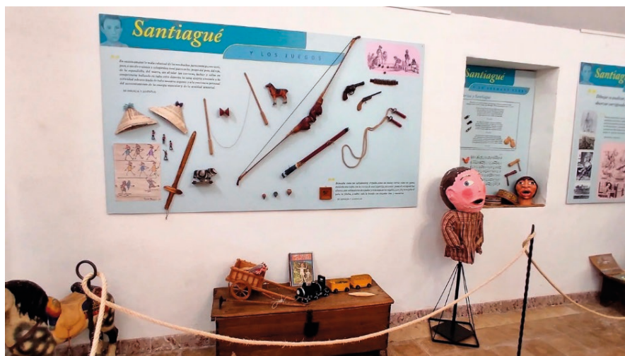
Figura 3. Una de las salas de la exposición dedicada al joven Santiagué por la Asociación para la Promoción Integral de Ayerbe y Comarca en 2022, para contribuir a la celebración del 170 aniversario del nacimiento de Ramón y Cajal, y recordar los años de infancia transcurridos en esa localidad.

Ante la rebeldía de Santiagué, su padre lo envió con 10 años a empezar el bachillerato en los Escolapios de Jaca, conocidos en la región por educar y domar a muchachos difíciles y revoltosos. Él insistía en que lo llevaran a Huesca o Zaragoza, ya que había escuelas de dibujo, que seguía siendo su ilusión preferente, pero su padre se negó en redondo, confiando en los Escolapios para que le enderezaran, ya que su padre quería que fuera médico, aunque a él, en ese momento, no le agradaba la medicina ( Fig. 4 ).