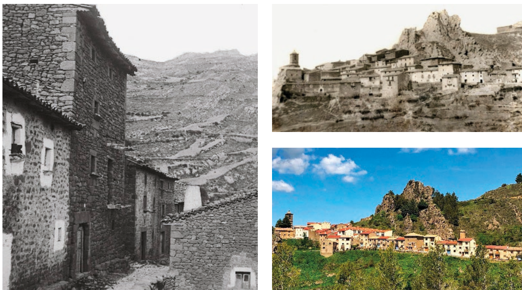
Figura 1. Casa natal en Petilla de Aragón, Navarra. Fotografía de Santiago Ramón y Cajal tomada en 1892 (Izqda.); el pueblo antes, fotografía de Santiago Ramón y Cajal (Dcha. sup.) y ahora (Dcha. inf.)

Se trasladaron después a la populosa villa zaragozana de Luna en 1855, y poco más tarde a Valpalmas, localidad próxima a la anterior donde nacieron sus hermanas Pabla y Jorja, y en la que la familia Ramón y Cajal permaneció hasta 1860.