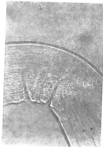
Estriaciones de la cutícula 200 X) Microfotografía

Los caracteres morfológicos de estos nemátodos corresponden a los de la familia Ostertaginae LÓPEZ-NEYRA, 1947, género Marshallagia ORLOV, 1933, cuya especie tipo es Marshallagia marshalli , RANSOM,