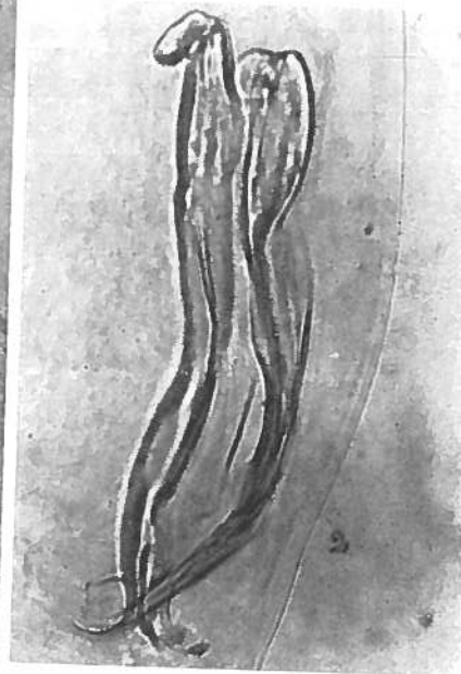
Aspecto de las espículas 315 X) Microfotografía

1907), ORLOV, 1933. SPREHN (1956) 1 ha redescrito los caracteres de este género, que él sigue considerando como subgénero de Ostertagia , de acuerdo con ORLOV (1933) 2 .