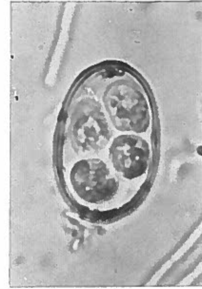
Fig. 2 Los esporoblastos ya formados. Ha aparecido la masa de gránulos refringentes polares