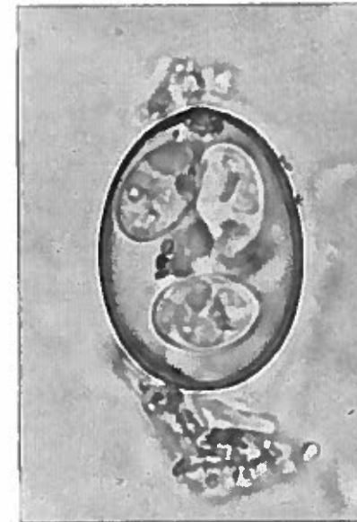
Fig. 3 La esporulación se ha completado. Los gránulos que aparecen en posición ecuatorial son detritus fecales adheridos a la pared del ooquiste.