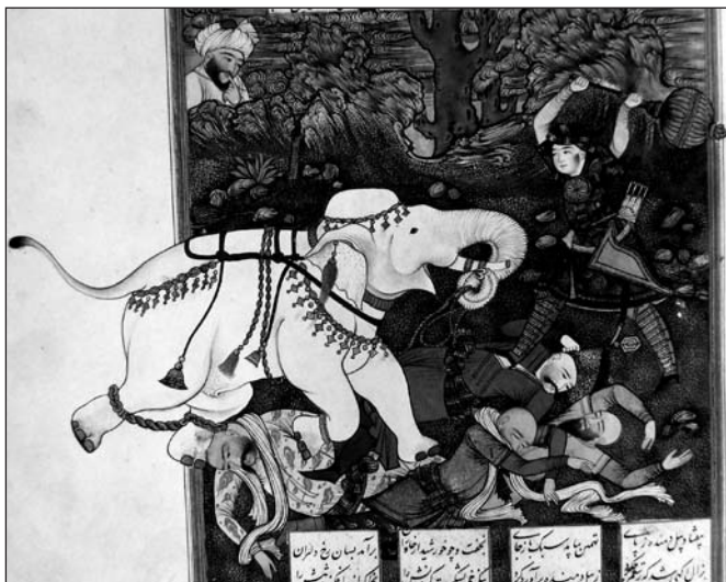
MINIATURA “ROSTAM MATA EL ELEFANTE BLANCO”, DEL MANUSCRITO DE ŠĀHNĀME-YE DEYLAMI DEL PERIODO SAFÁVIDA (1502-1722 D.C.). NÓTESE QUE ROSTAM USA UNA MAZA CON UNA CABEZA REDONDA PARA MATAR AL ELEFANTE.

El muslo del caballo era un blanco para un golpe con la maza, como describe el manuscrito Dārābnāme-ye Tarsusi con la expresión amud bar rān-e asp zadan (golpear el muslo del caballo con la maza) (Tarsusi, 1977/2536:24, vol. 1).