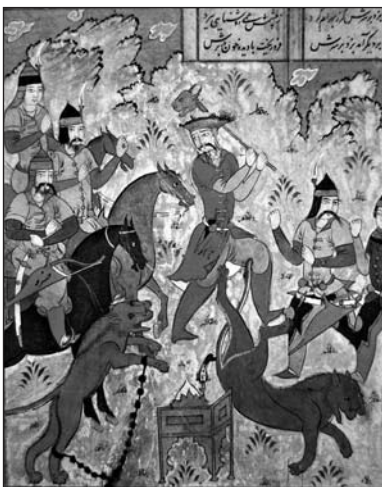
OTRA MINIATURA ALUSIVA A LA ESCENA “BAHRĀM MATA LOS LEONES”, DE UN MANUSCRITO DE ŠĀHNĀME DATADO DEL 1048 DE LA HÉGIRA (1638 D.C.). EN ESTA OCASIÓN, BAHRĀM UTILIZA UNA MAZA DE CABEZA DE TORO.