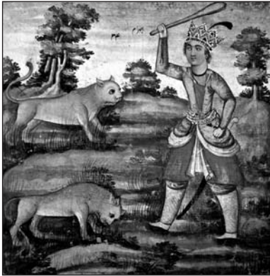
LA MINIATURA “BAHRĀM MATA LOS LEONES”, DE UN MANUSCRITO DE ŠĀHNĀME DEL PERIODO QĀJĀR (1794-1925 D.C.), MUESTRA A BAHRĀM USANDO UNA MAZA PARA MATAR A DOS LEONES.