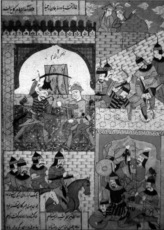
MINIATURA “EL COMBATE ENTRE FERAYDUN Y ZAHHĀK”, DATADA EN EL 1048 DE LA HÉGIRA (1638 D.C.). NÓTESE QUE FERAYDUN USA UNA MAZA DE CABEZA DE TORO PARA GOLPEAR A ZAHHĀK.