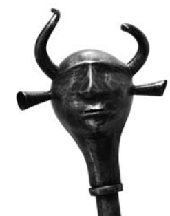
DETALLE DE UNA GORZ-E DIVSAR (MAZA DE CABEZA DE DEMONIO) DEL PERIODO QĀJĀR (1794–1925 D.C.).