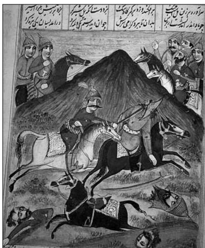
MINIATURA DE UN MANUSCRITO DE ŠĀHNĀME, AÑO 1212 DE LA HÉGIRA (1797 D.C.), QUE MUESTRA UN GUERRERO DECAPITANDO A SU Oponente CON UN GOLPE DE HACHA EN DIAGONAL.