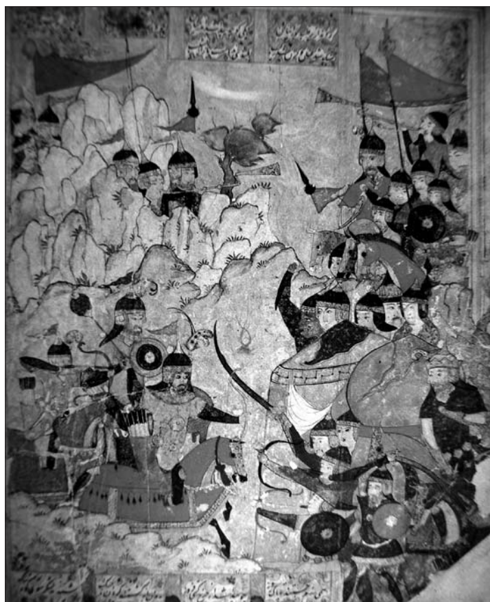
MINIATURA “EL ATAQUE DE IRANÍS CONTRA EL EJÉRCITO DE TURĀN” DE UN MANUSCRITO DEL ŠĀHNĀME, DEL S. X DE LA HÉGIRA (S. XVI D.C.). NÓTESE EL GUERRERO QUE PORTA UNA MAZA DE CABEZA REDONDA.