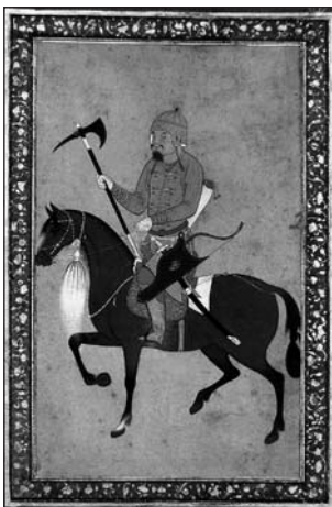
MINIATURA “UN CABALLERO CON UNA HACHA”, DEL S. XI DE LA HÉGIRA (S. XVIII D.C.).

El guerrero que luchaba con hacha se denominaba tabarzan en Zafarnāme Yazdi del s. XV (1957/1336a:474), y tabardār , en Abu Moslemnāme del s. X (Tartusi, 2001/1380:124; vol. 4). Los guerreros que lanzaban su hacha en el combate eran tabarandāz ( Romuz-e Hamze , recolectado en el s. XV, 1940/1359 Hégira:123). Existe