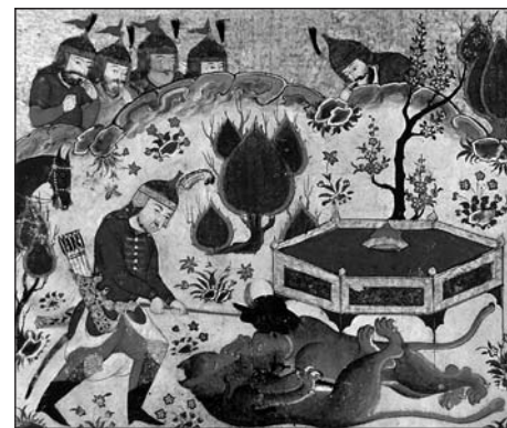
MINIATURA “BAHRĀM TOMA LA CORONA REAL Y MATA LOS LEONES”, DE UN MANUSCRITO DE ŠĀHNĀME DATADO DEL 1030 DE LA HÉGIRA (1621 D.C.).

Cortesía de la Librería de Mártir Motahari.