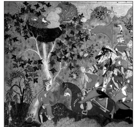
MINIATURA “LA HISTORIA DE SIMORQ Y ZĀL”, DE UN MANUSCRITO DEL ŠĀHNĀME NO FECHADO. NÓTESE EL GUERRERO QUE PORTA UN HACHA SOBRE EL HOMBRO.

Antes de golpear con un hacha, a veces se giraba el hacha alrededor de la cabeza para obtener un mayor impulso y realizar normalmente un golpe vertical hacia abajo, como describe el manuscrito Abu Moslemnāme , del s. X, con la expresión tabar bar gerd-e sar gardāndan (girar el hacha alrededor de la cabeza) (Tartusi, 2001/1380:584; vol. 1).