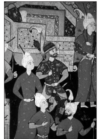
MINIATURA “KEYKĀVUS RECIBE A KEYXOSRŌ”, DEL MANUSCRITO DE ŠĀHNĀME-YE ŠĀH ESMĀILI [NO FECHADA]. NÓTESE EL GUERRERO QUE PORTA UNA MAZA DE ARMAS.

Existen expresiones persas genéricas que designan el ataque con una maza, como gorz zadan (golpear con una maza), tal y como indica el manuscrito Ādāb al-Harb va al-Šojā-e