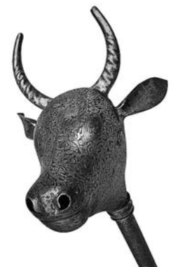
DETALLE DE UNA AMUD-E GĀVSAR (MAZA DE CABEZA DE TORO) DEL PERIODO QĀJĀR (1794–1925 D.C.).