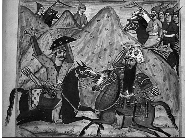
MINIATURA DEL MANUSCRITO DEL ŠĀHNĀME (1212 DE LA HÉGIRA, 1797 D.C.), MOSTRANDO A ROSTAM, HÉROE IRANÍ, LUCHANDO CON UNA MAZA DE CABEZA DE TORO.