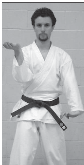
BLOQUEO EN FORMA DE CUCHARA (SUKUI UKE).

Basándose en estas observaciones, dos veteranos instructores de Goju-ryu identificaron diez temáticas entre las katas Goju-ryu. Luego cada kata fue valorada por los instructores por la presencia (1) o ausencia (0) de cada temática (Tabla 1). La temática predominante fue la simetría de una kata y fue definida como el porcentaje de técnicas repetidas con ambos lados del cuerpo. Una kata fue considerada simétrica si tenía más del 20% de repetición de técnicas con ambos lados del cuerpo.