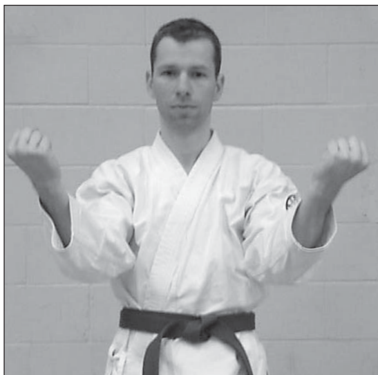
DERECHA: PATADA FRONTAL (MAEGERI).

El análisis de conglomerados basado en la categorización de temáticas en la Tabla 1 reveló que las katas clásicas formaban dos conglomerados (Figura 1). El primer conglomerado incluiría Sesan, Suparimpei/Pechurin, y Sanseru. El segundo conglomerado incluiría Saifa, Shisochin, Seipai, Kururunfa, y Seiunchin. El primer conglomerado fue etiquetado como el Conglomerado Higaonna (Conglomerado H). El segundo conglomerado fue etiquetado como el Conglomerado Miyagi (Conglomerado M). Esto hizo surgir algunas preguntas importantes en relación a la evolución del Goju-ryu moderno tal y como fue formulado por Miyagi Chojun.