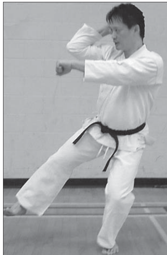
DEBAJO: PATADA A LA RODILLA (KANSETSUGERI).