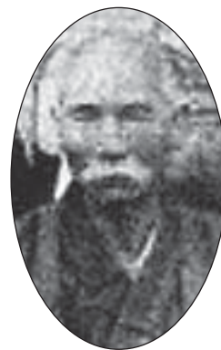
ITOSU ANKO – LA PRINCIPAL PERSONA RESPONSABLE DE LA MODERNIZACIÓN DEL KÁRATE-DO