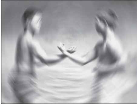
UN JOVEN MIYAGI CHOJUN (IZQUIERDA) Y KYODA JUHATSU DEMOSTRANDO TÉCNICAS.

Ya adulto, Miyagi organizó el kárate que había aprendido de Higaonna y éste fue aceptado como parte de la escuela comercial de la prefectura de Okinawa. Este fue el kárate de Miyagi que más tarde llamaría Goju-ryu. Es interesante especular si una de las motivaciones de Miyagi para introducir el Goju-ryu en el sistema escolar fue el recuerdo de la amargura de su maestro y la temprana popularidad del kárate de Itosu.