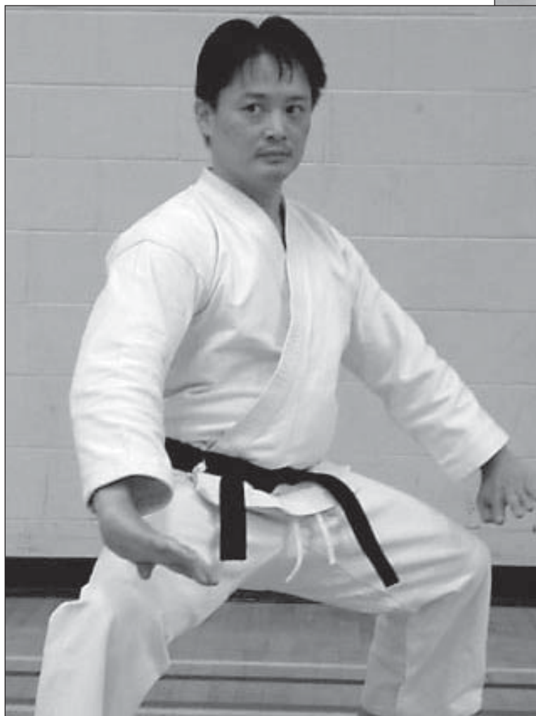
ENCIMA: MOVIMIENTO DE APERTURA DE LA KATA SEIUNCHIN.