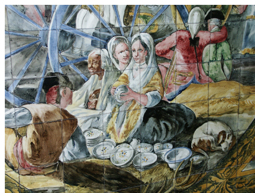
▪ Fig. 11. Daniel Zuloaga. Detalle del mural de El cacharrero en el portal de la casa de Armando Otero, calle Hurtado de Amézaga nº 48 (Bilbao). 1919. Foto de la autora.