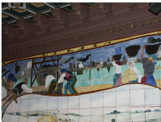
▪ Fig. 5. Daniel Zuloaga. Plafón que remata el mural de la escena de los labriegos segovianos en el portal de la casa de Nicolás Murga, calle Gardoqui nº 11 (Bilbao). 1902.

Se da la circunstancia de que fue inaugurado en julio de 1899, es decir poco antes de la visita del ceramista 31 . Las construcciones anejas pertenecerían a la antigua fábrica La Vizcaya , fundada en 1882 por un grupo de empresarios, entre los que figuraban varios miembros de la familia Chávarri. El proyecto de este complejo industrial, dotado de tres altos hornos, fue realizado por la firma belga Cockerill y su construcción concluyó en 1884 32 (Fig. 5).