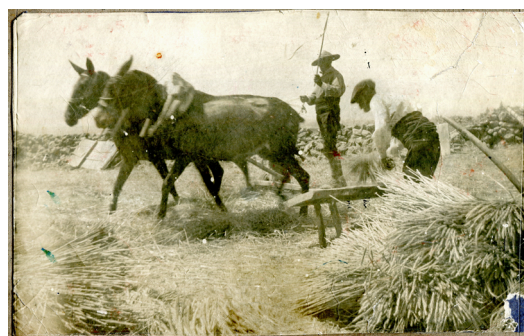
▪ Fig. 7. Fotografía del Archivo de Daniel Zuloaga. Archivo Daniel Zuloaga Segovia-Junta de Castilla y León.

Poco después de su desplazamiento a este paraje vizcaíno, Zuloaga debió realizar el boceto que más tarde utilizó para ilustrar