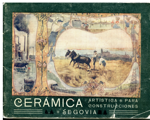
▪ Fig. 1. Daniel Zuloaga. Portada de catálogo comercial de sus productos. 1904.

9 Cerámica artística para construcciones. Segovia (Madrid, sin editor, 1904), s.p.