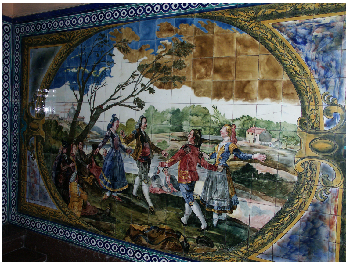
▪ Fig. 12. Daniel Zuloaga. Mural de El Baile de San Antonio de la Florida en el portal de la casa de Armando Otero, calle Hurtado de Amézaga nº 48 (Bilbao). 1919.

tras que el segundo, realizado en 1919, deja constancia de la ascendencia de Goya sobre el ceramista, influjo que se intensificó al final de la vida de Zuloaga, fallecido en 1921, cuando el regionalismo se impuso claramente sobre las otras dos corrientes anteriormente señaladas. A su vez estos zaguanes revelan pautas habituales en la forma de trabajar del artífice, quien a la hora de diseñar este tipo de revestimientos utilizó frecuentemente fotografías, aunque introduciendo ligeras modificaciones sobre los originales en función de sus intereses. Igualmente se constata su tendencia a dibujar y pintar detalles del natural, de cara a la ulterior realización de plafones, como ocurrió en parte de los paneles del edificio de Murga, su seguimiento de las obras tanto con visitas a las mismas como con instrucciones detalladas a los operarios de su taller, los pasos de cara a los preparativos del envío e instalación de los revestimientos con la realización de los corres-