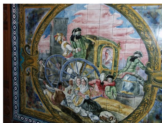
▪ Fig. 10. Daniel Zuloaga. Mural de El cacharrero en el portal de la casa de Armando Otero, calle Hurtado de Amézaga nº 48 (Bilbao). 1919.

A la hora de materializar este mural 84 , Zuloaga reprodujo el modelo original en lo tocante a la composición, el número y el tipo de las figuras, las indumentarias, las actitudes y gestos, aunque los rostros tienen un tratamiento más somero y la factura sea especialmente suelta. Los tonos rosados que dominan en el celaje y los blancos perlados y agrisados de parte de los trajes son más intensos que en el modelo goyesco y constituyen un inequívoco homenaje al artista aragonés que utilizó mucho esas gamas (Figs. 10 y 11).