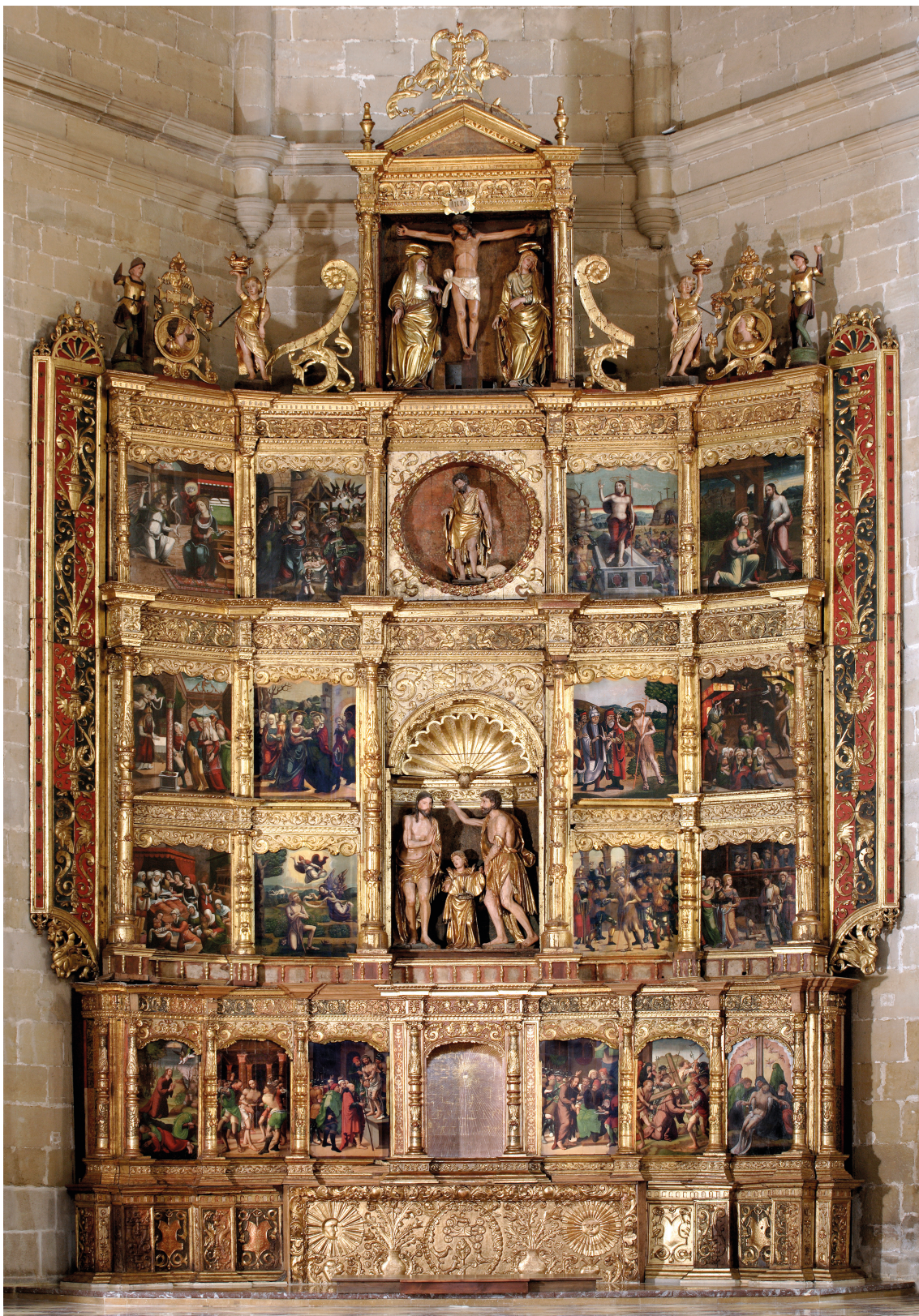
▪ Fig. 1. Esteban de Obraj y Guillemín Leveque (mazonería); Gabriel Joly (atribuido a, imágenes); Pedro de Ponte y ¿Juan Giner? (pintura). Retablo mayor de San Juan Bautista de Cintruénigo. A partir de 1525.