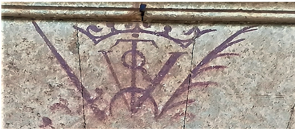
▪ Fig. 1. Anónimo. Anagrama, media luna, corona, espada y la pluma. Segunda mitad del siglo XVI. Ciudad Rodrigo, Palacio de los Ávila y Tiedra.

gro para destacar más en algunas ocasiones, como el caso de los vítores en la fachada de la Casa de los Miranda.