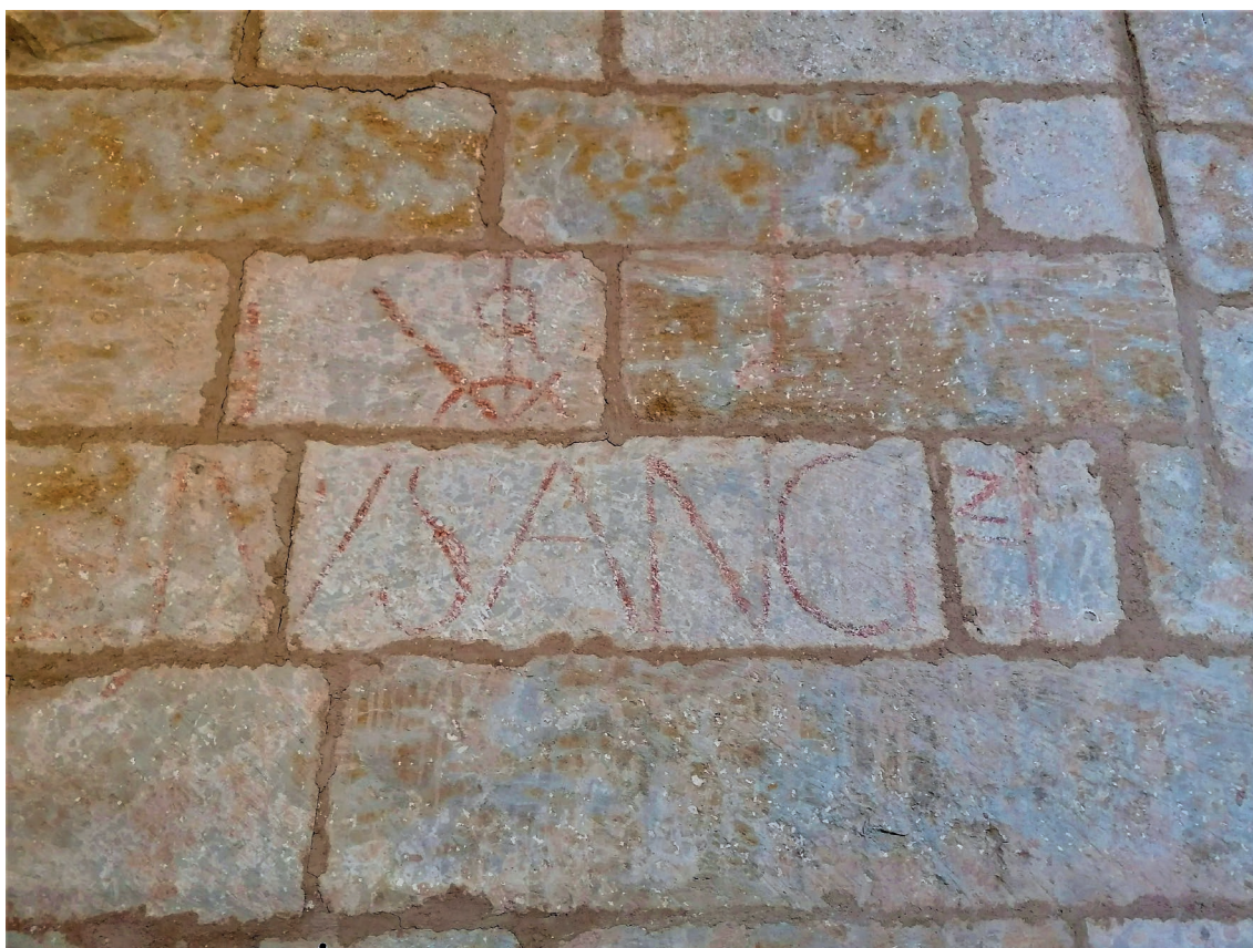
▪ Fig. 6. Anónimo. Boceto de un vitor. Siglos XVI-XVII. Ciudad Rodrigo, catedral de Santa María, escaleras de acceso al actual museo catedralicio.

en los inmuebles que se destinaron a alojar tropas o con fines militares ni en el alcázar. Sí existe un vitor en la portada del Hospital de Pasión y otro en la casa del priorato de la parroquia de San Juan.