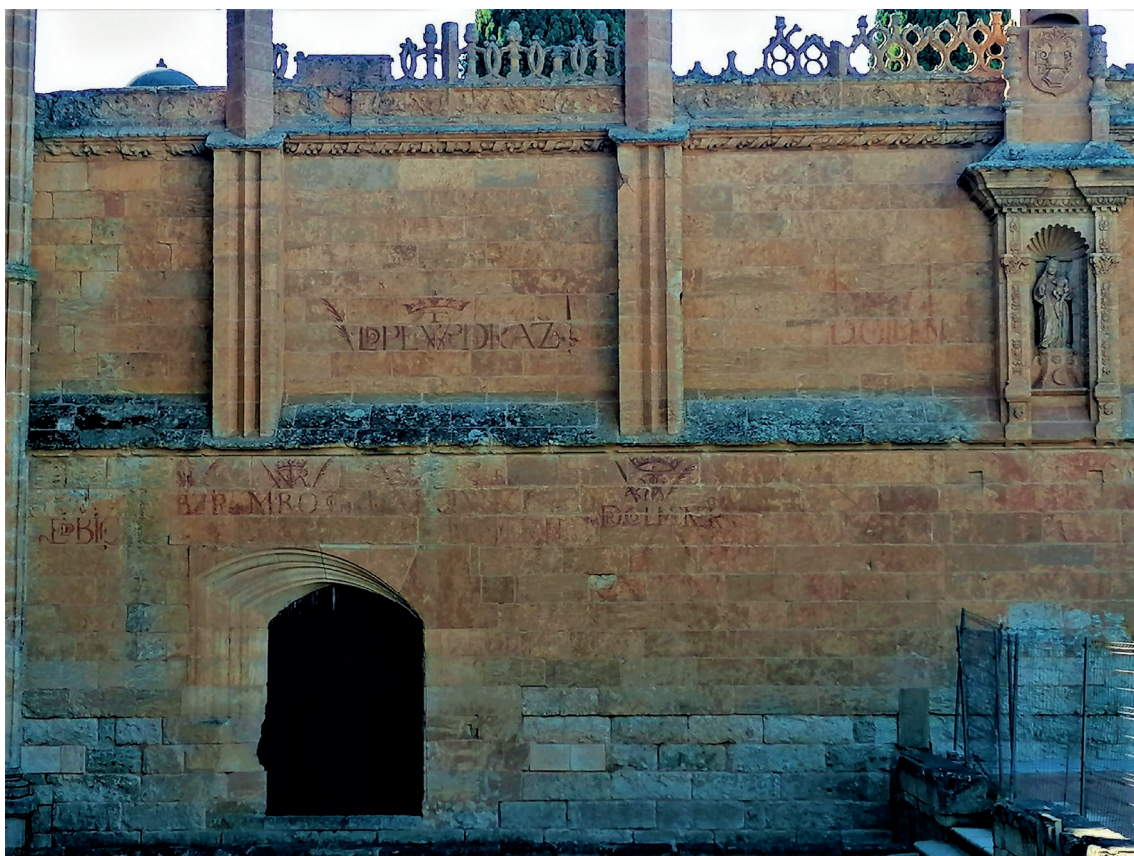
▪ Fig. 2. Anónimo. Vítore. Siglos XVI-XVII. Ciudad Rodrigo, catedral de Santa María, fachada exterior del claustro.

te de sus elementos y dificulta su lectura y visualización y aquellos que solo han sido percibidos gracias al tratamiento informático o pasan completamente inadvertidos por los avatares urbanísticos 25 (Fig. 2).