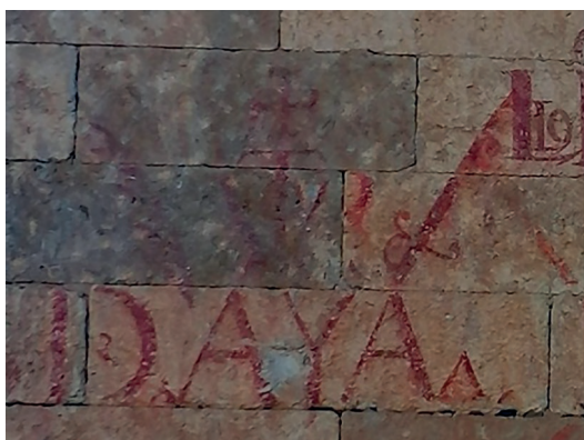
▪ Fig. 5. Anónimo. Vítor del Dr. Ayala, ca. 1626. Ciudad Rodrigo, catedral de Santa María, fachada exterior de la sacristía.

da Silva 38 . De esta segunda época figura la intitulación de “Guillén bis vítor” junto con una corona, dos espadas y dos plumas.