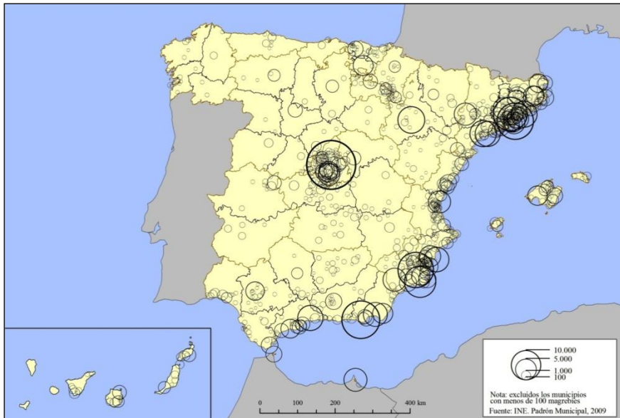
Mapa 1. Distribución de los marroquíes y argelinos empadronados en España, 2009 (municipios con más de 100 magrebíes)